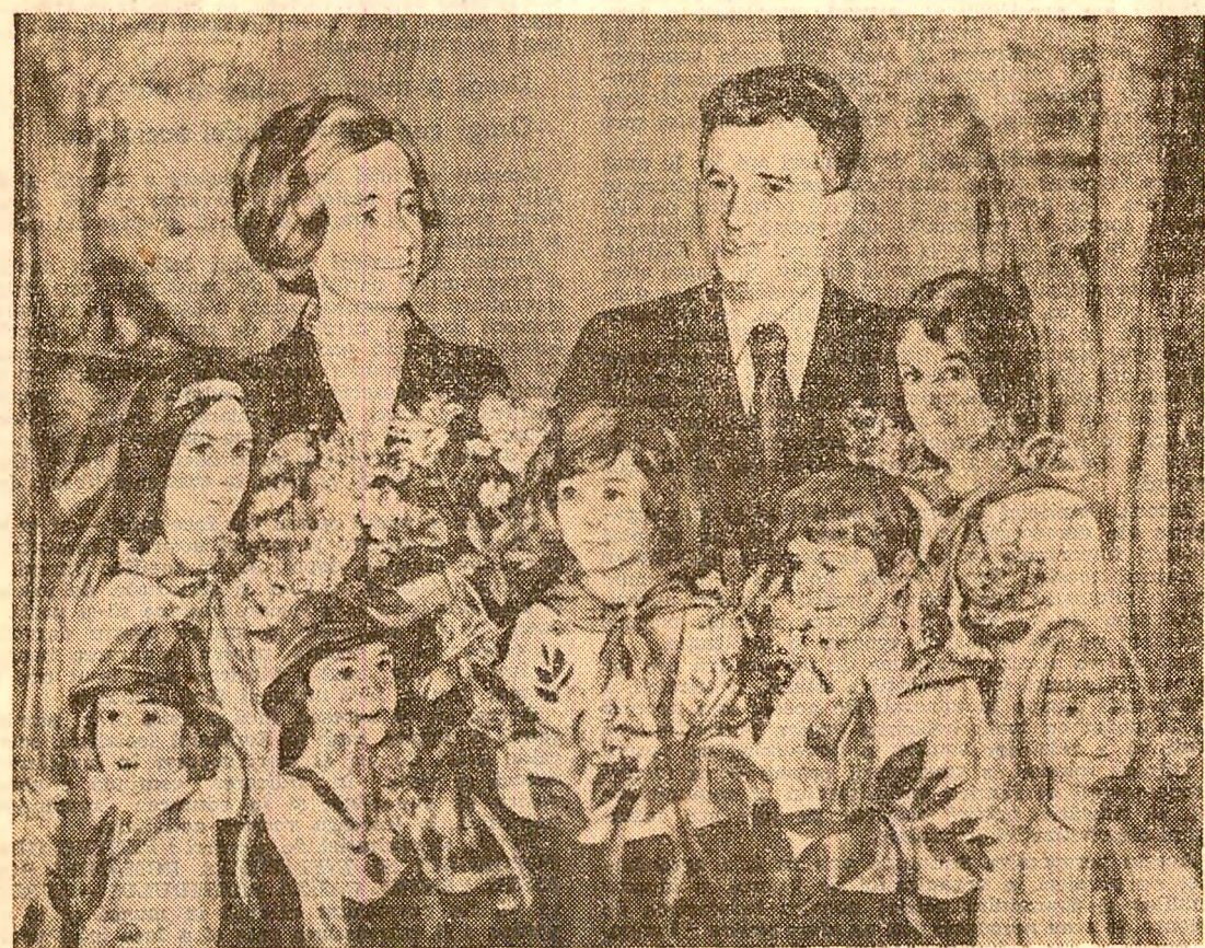
Pictură de ZAMFIR DUMITRESCU

Vă vom urma îndemnul înțelept: Să învățăm pentru progresul țării, Vom merge, neclintit, pe drumul drept Al faptei îndrăznețe și-nălțății.