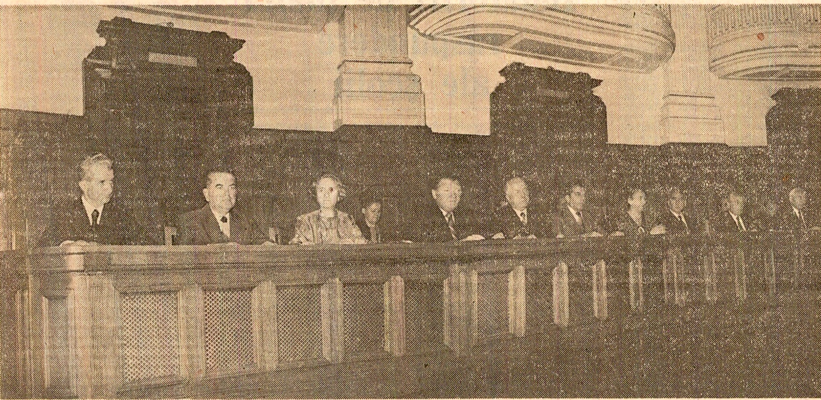
În prezența tovarășului Nicolae Ceaușescu, secretar general al Partidului Communist Român, președintele Republicii Socialiste România, vineri, 29 iunie, s-au reluat lucrările în plen ale sesiunii a noua a celei de-a opta legislaturi a Marii Adunări Naționale.

Marea Adunare Națională, forul suprem al puterii de stat, dînd glas aspirației fierbinți și voinței ferme a întregii noastre națiuni, a exprimat entuziasta adeziune față de Hotărîrea plenarei C.C. al P.C.R. cu privire la realegerea tovarășului Nicolae Ceaușescu, la Congresul al XIII-lea, în înalta funcție de secretar general al partidului