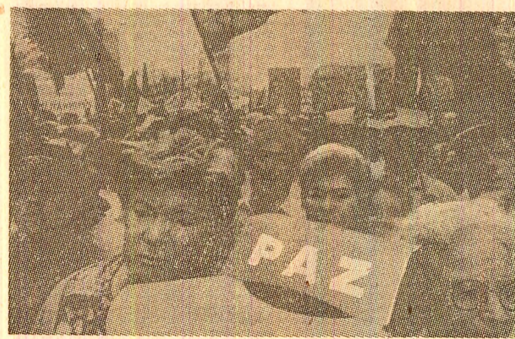
Sub această lozincă, mișcările antinucleare din Spania desfășoară acțiuni tot mai ample și numeroase.

fiecare lozincă fiind punctată cu aplauze și reținută de cetățenii ce asistau la acea manifestație suigeneris. „Pacea nu se poate obține doar dorînd-o. Dacă vrem pace, trebuie să luptăm pentru pace”. Aceste cuvinte care domină „Zidul Păcii” poartă semnătura primarului capital spaniol, Enrique Tierno Galvan. Apoi, copiii au scandat: „Să cliidăm o lume a păcii și dreptății”. „Noi, copii, dacă ne vor lăsa să trăim... vom moșteni acest pămînt”. „Lăsați copiii să crească și florile să înflorească”. „În lume s-a domnesc numai pacea”. „Pacea este unicul viitor”. Și, în torcîndu-se spre cei ce se adunaseră în Plaza del Carmen, copiii le-au adresat următoarele cuvinte care nu erau înscrise pe „Zidul Păcii”: „Voi, care sînteți părinți și frații noștri, uitați-vă la noi și răspundeți: precîc ca noi să pierim? Dacă nu doriți aceasta — și știm că nu o doriți — faceți ce vă cere conștiința voastră și ceea ce vă cerem și noi: luptați pentru pace, acționați pînă nu este prea tîrziu”. Acțiunile de protest desfășurate în numeroase localități și îmbrăcîndele largul curent de opinie existent în favoarea ieșirii țării din Alianța militară nord-atlantică, la care Spania a aderat în mai 1982, din inițiativa fostului guvern de centru dreapta și sub presurarea cercurilor militare atlantice. Importanța Spaniei pentru strategia N.A.T.O. decurge din poziția sa ca bază logistică și ca punct de control asupra intrării în Mediterana și asupra unei întinse zone a Atlanticului. În viziunea cercurilor con-