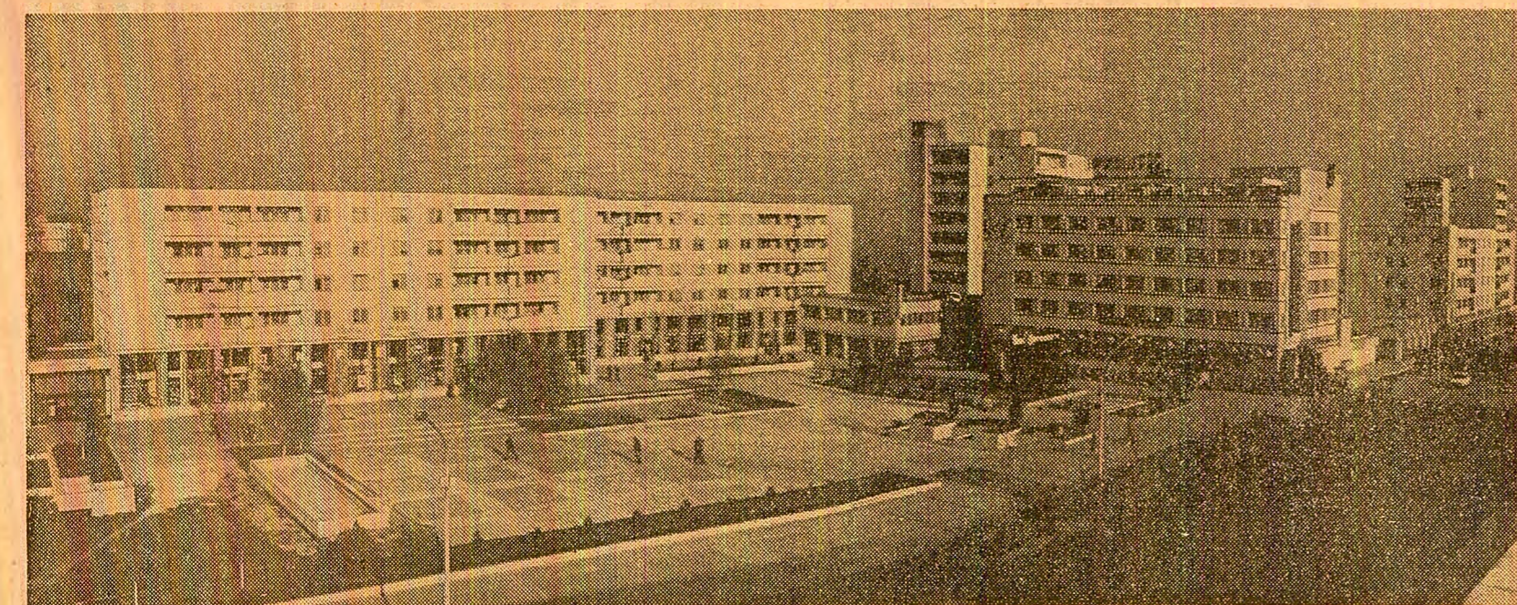
Un nou peisaj arhitectonic al Birăduului