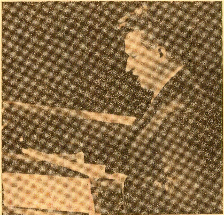
Președintele Nicolae Ceaușescu vorbind la sesiunea jubiliară a O.N.U., din 1970