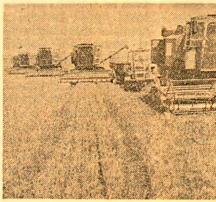
ne creează condiții optime să ne lucrăm în liniște ogoarele, să ne înălțăm țara, așa cum n-a fost niciodată.

Dacă în uzine și fabrici muncitorii îndeplinesc cu cinste sarcinile ce le revin la locul de muncă, pentru noi, în agricultură, îndatorirea de căpătîi este obținerea unor recolte tot mai mari. Iată, la noi în cooperativă, anul acesta am realizat la grîu 5 725 kg la hectar, iar la orz 7 455 kg la hectar — cele mai mari producții din istoria comunei noastre. Politica partidului de pace, de bună vecinătate, de înțelegere