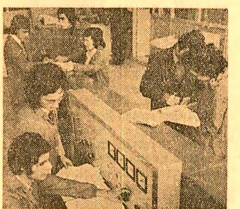
o partidului — o politică care apără viitorul tinerilor din țara noastră, al tinerilor de pretutindeni.

„Sînt studentă la Universitatea din Cluj-Napoca și cred că exprim nu numai gîndurile mele, ci și cele ale tuturor tinerilor din țara noastră cînd spun că noi, cei ce ne aflăm la porțile afirmării în viață, dorim să ne bucurăm de un viitor de pace, ferit de amenințarea războiului, dorim să ne realizăm ca oameni, să ne făurim familii, să contribuim prin cunoștințele noastre la înălțarea patriei, restituind astfel societății noastre socialiste ceea ce ea ne-a dat cu atîta generozitate: condiții optime de învățură. Pentru noi, tinerii, acestea sînt cele mai scumpe visuri și idealuri. Dar sîntem conștienți, în același timp, că aceste visuri și idealuri sînt grav amenințate de spectrul unui holocaust nuclear. Știm că partidul nostru, secretarul său general fac totul pentru a alunga din viața omenirii acest spectru. Este acesta unul din argumentele vitale care îndreptățesc atașamentul nostru deplin la politica externă de pace