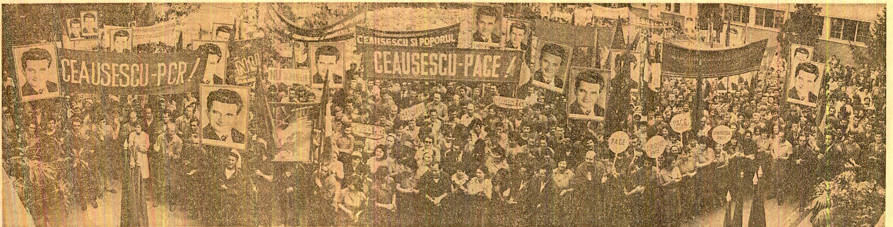
„CEAUȘESCU — PACE”: O simbolică alăturare, exprimînd atașamentul profund al întregului popor la politica externă a României socialiste, elaborată și promovată cu atîta strălucire de secretarul general al partidului, președintele Republicii

(DIN CONSTITUȚIA REPUBLICII SOCIALISTE ROMANIA)