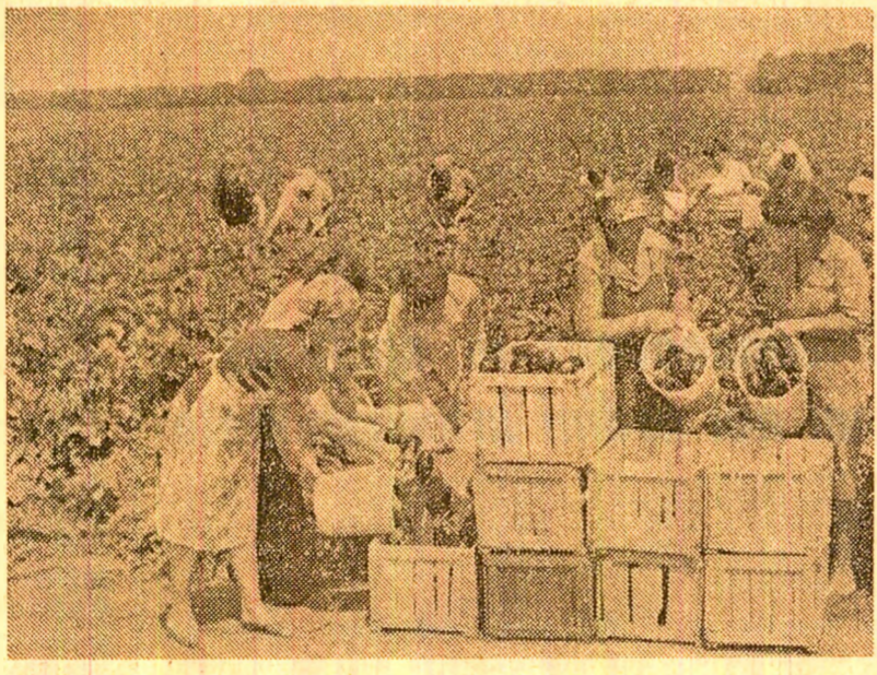
I.A.S. Nazareca, județul Constanța: importante forțe umane și mijloace de transport sint concentrate la recoltarea legumelor