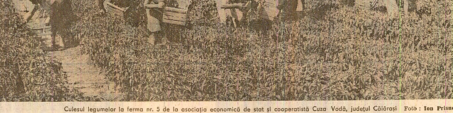
Culesul legumelor la ferma nr. 5 de la asociația economică de stat și cooperativă Cuza Vodă, județul Călărași.