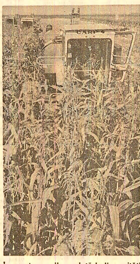
În pagina a II-a relații din unități agricole brașlene

● Transportul produselor agricole din cîmp să se desfășoare ritmic, pentru ca tot ce se stringe în cursul unei zile pînă seara să ajungă în magazine.