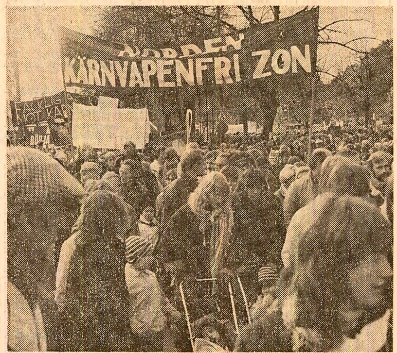
În capitala Suediei au loc frecvent ample demonstrații ale militanților pentru pace și dezarmare...