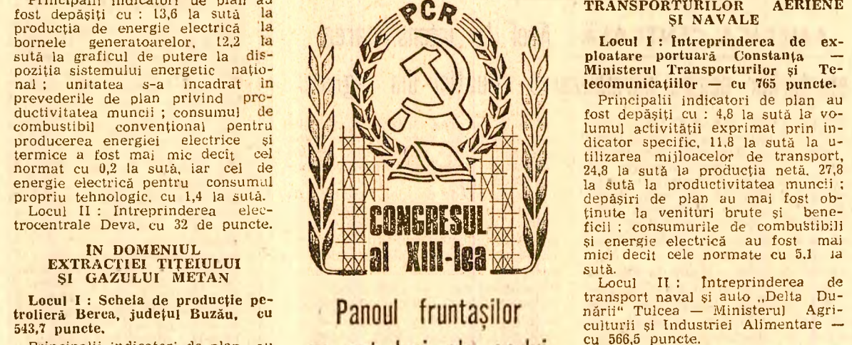
Panoul fruntaşilor pe opt luni ale anului