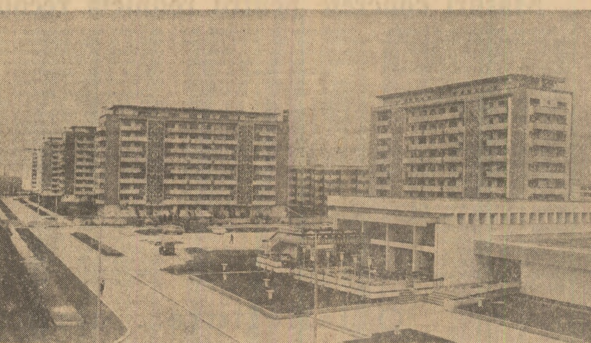
De la noile construcții ale municipiului Ploiești