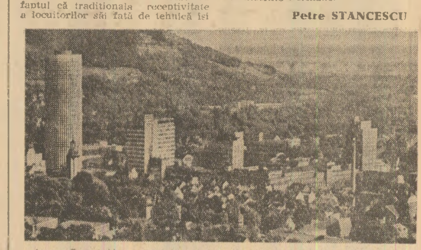
Jena: Turul Universității și clădirile Combinatului „VEB - Carl Zeiss”