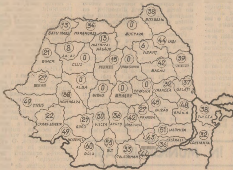
STADIUL RECOLTĂRII PORUMBULUI, în procente, în seara zilei de 9 octombrie. (Date furnizate de Ministerul Agriculturii și Industriei Alimentare)

Tempul este foarte înalt și în momentul de față nu există sarcini mai importante pentru mecanizatori, cooperatori, specialiști din unitățile agricole, pentru toți oamenii muncii de la sate decât acela de a strânge și pune la adăpost cât mai repede întreaga recoltă, de a însemna neîntârziat griul, cerealele cereale păioase. Acum toate lucrările sunt urgente. Cu deosebire se impune necesitatea de a se impulsiona la maximum recoltarea porumbului, întrucât a ajuns la maturitate pe toate suprafețele. În multe unități agricole se înregistrează rămâniri în urmă cu totul nejustificate. Potrivit datelor furnizate de Ministerul Agriculturii și Industriei Alimentare, porumbul a fost strins până marți seara de pe numai 84 la sută din suprafața cultivată. Cu puține excepții — Olț, Dolj, Ialomița și sectorul agricol Ilfov —