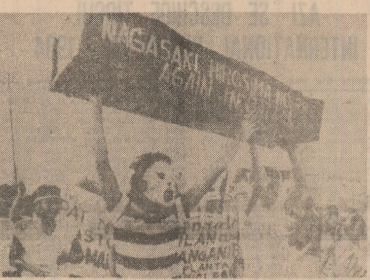
Simulind, prin costumele lor, efectele dezastruoase ale unui eventual război nuclear, participanții la o recentă demonstrație de protest împotriva curselor înarmărilor desfășurate în orașul Batjan, din Filipine, poartă o pancartă pe care scrie: „Niciodată să nu se repete ororile de la Nagasaki și Hiroshima!”