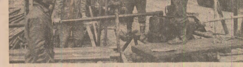
Trustul de extracție Pitești. Brigada de producție petrolieră Merișani