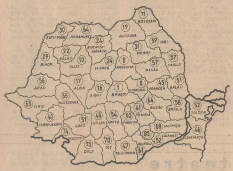
Stadiul recoltării porumbului. Cifrele înscrise pe hartă reprezintă, în procente, pe județe, suprafețele de pe care a fost strîns porumbul pînă în seara zilei de 16 octombrie, în județele marcate cu zero, recoltarea nu a început. (Date comunicate de Ministerul Agriculturii)