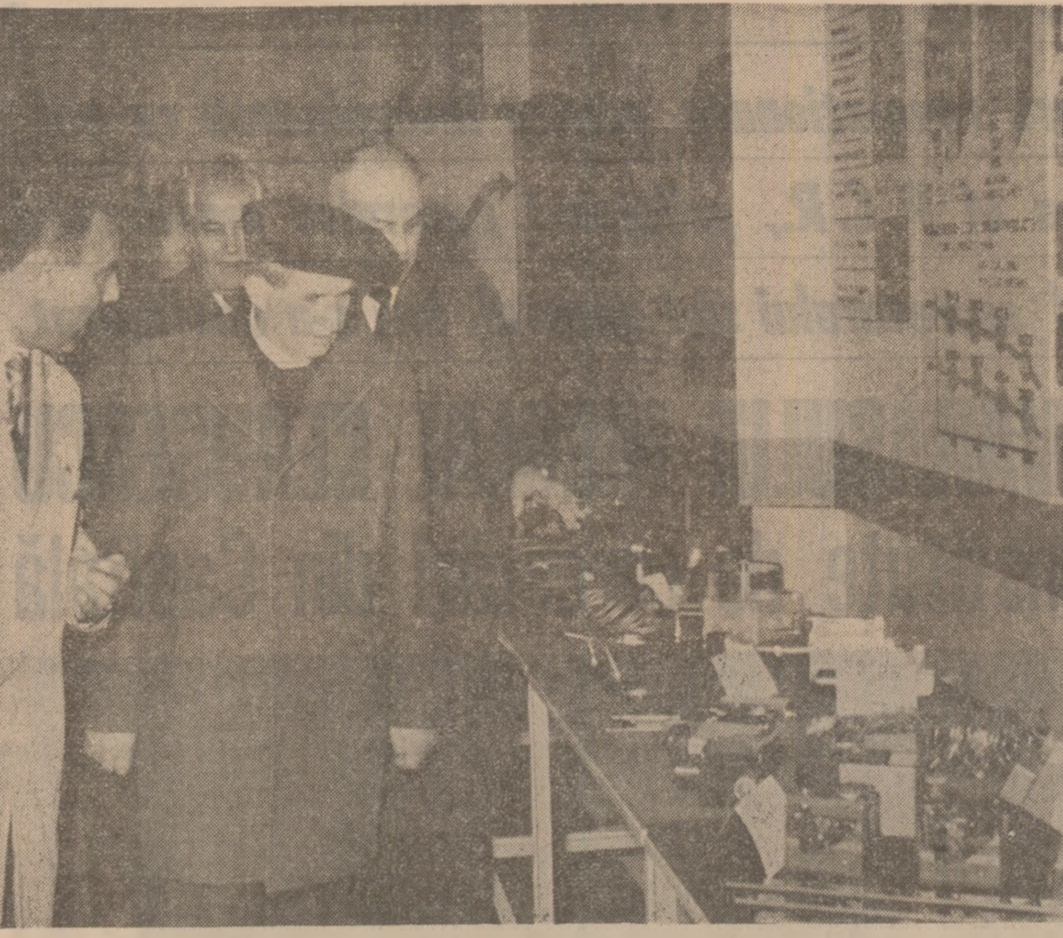
Sînt prezentate noi realizări ale colectivului întreprinderii de mecanică fină

Vizitînd secțiile circuite integrate și tranzistoare cu siliciu, secretarul general al partidului este informat că, de curînd, I.P.R.S.-Băneasa a trecut la fabricarea unor componente profesionale destinate programelor speciale și a tranzistoarelor de comutație și automatizare, care deosebit de solicitate în cadrul proceselor de automatizare și robotizare.