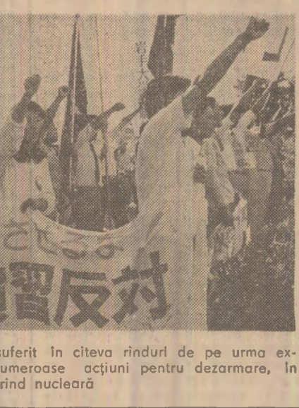
În Japonia, țara care a avut de suferit în clevea rindurii de pe urma exploziilor atomice, se desfășoară numeroase acțiuni pentru dezarmare, în primul rând nucleară