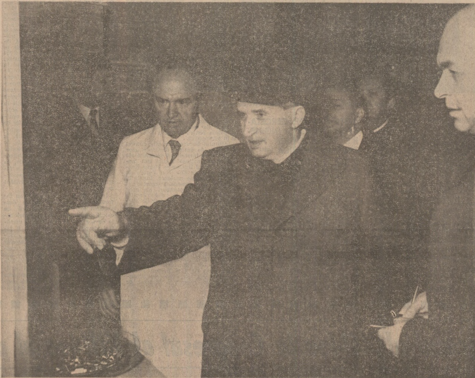
Aspect din timpul vizitei la Centrul de cercetare științifică și inginerie tehnologică pentru semiconductoare

Înflăcărare de luminosul exemplu de dăruire patriotică, revoluționară al conducătorului iubit al partidului și statului nostru, colectivele de oameni ai muncii din Capitală și-au reafirmat și cu acest prilej hotărîrea fermă de a întări prin noi fapte de muncă voința unanimă a întregului popor ca la cel de-al XIII-lea Congres al partidului tovarășul Nicolae Ceaușescu să fie reales în funcția