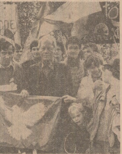
În localitatea Unkel, de lângă Bonn (R.F. Germania), printre participanții la „lanțul vii” s-a numărat și Willy Brandt, președintele P.S.D. și al Internației socialiste, protestind împotriva amplasării noilor rachete nucleare

La Copenhaga, capitala Danemarcei, s-a desfășurat o urioasă demonstrație, sub lozinci ca: „Nu — războiului atomic!”; „Nu permiteți repetarea tragediei de la Hiroshima!”