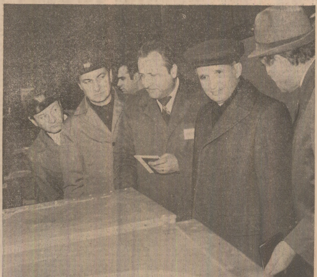
Se prezintă exploații în cadrul dialogului de lucru de la Întreprinderea „Aversa”