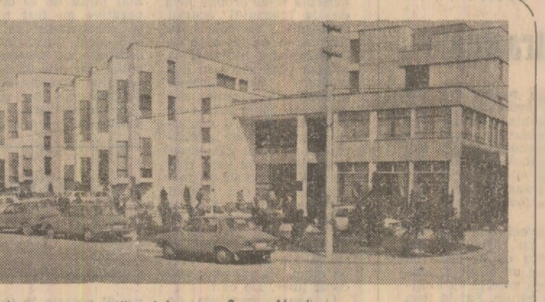
Cit cuprinde privirea — construcții noi în zona Someș-Nord

Un exemplu: producția industrială a județului a crescut de la 25,5 miliarde lei, cit era în 1980, la 33,9 miliarde lei în acest an. Fără îndoială, asemenea creștere valorică a fost obținută și pe seama noilor capacități