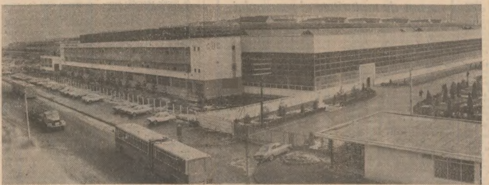
Cel mai mare obiectiv industrial din Cluj-Napoca: Combinatul de utilaj greu — citorie a „Epoiei Ceaușescu”

oțel, depășindu-se cu 3 000 tone angajamentul pe 1984.