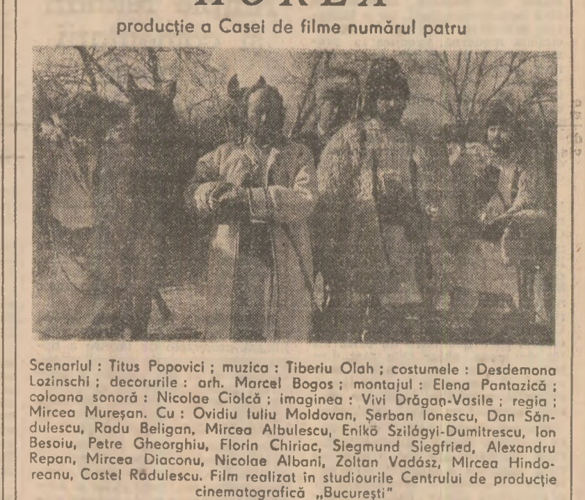
Scenariu: Titus Popovici; muzica: Tiberiu Olah; costumele: Desdemona...