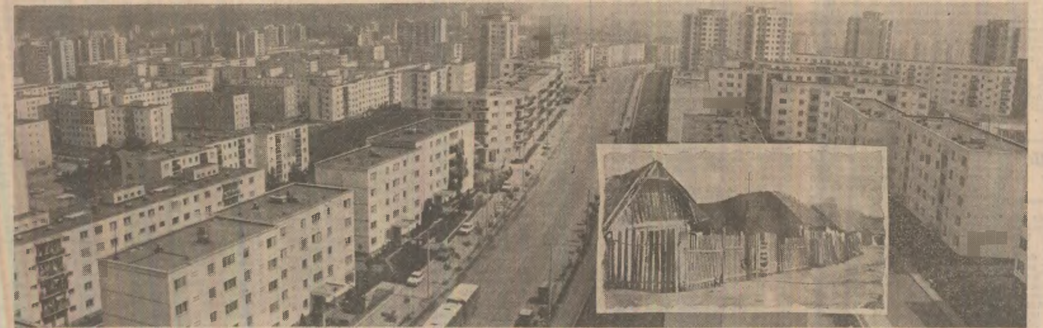
Ceea ce A FOST cartierul Mănăștur din municipiul Cluj-Napoca se vede în fotografia din medalia. Ceea ce ESTE — adică un veritabil oraș în oraș — s-a construit în ultimul deceniu

● In județ se desfășoară ample acțiuni de