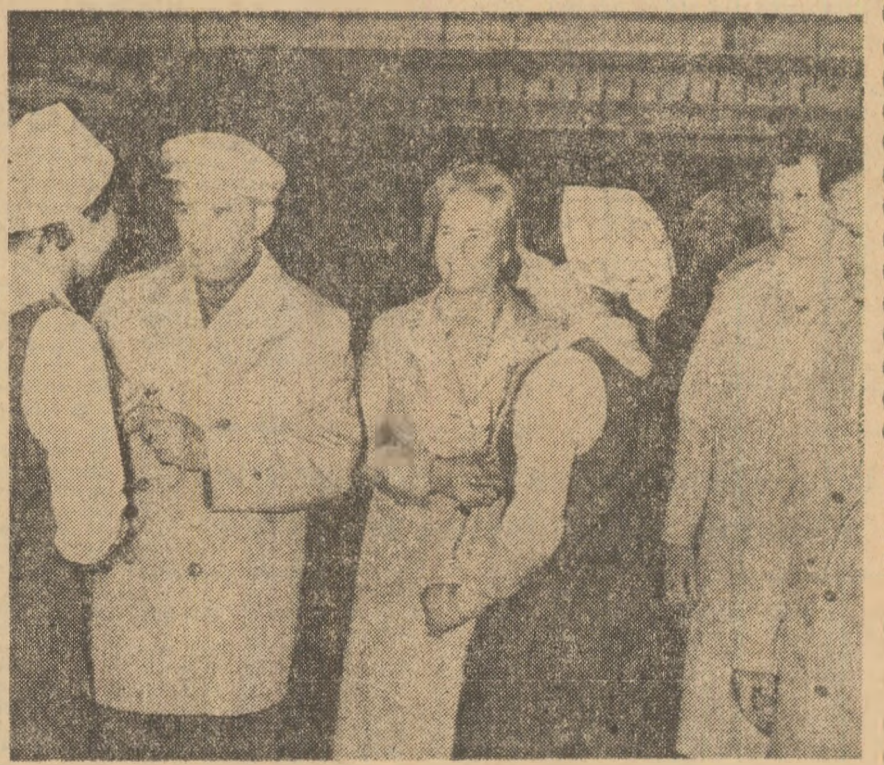
Momente emoționante din vizitele de lucru ale secretarului general al partidului, tovarășul Nicolae Ceaușescu, în unități industriale — expresie a unității indestructibile dintre partid și popor

În Spătarelu, Erou al Muncii Socialiste, prezidatele cooperativei agricole de producție — sîntem beneficiari ai istoriei. Prima vizită de lucru a secretarului general al partidului, tovarășul Nicolae Ceaușescu, a fost făcută în comuna noastră. Ne amintim mereu cuvintele spuse atunci: „Începem un drum nou și greu, tovarășii“. Argumentul meu pentru reelegerea tovarășului Nicolae Ceaușescu în funcția supremă îl constituie modul în care secretarul general al partidului spune poporului adevărul. Aceste cuvinte ne-au îmbărbătat să învingem toate greutățile care s-au ivit în calea noastră — și au fost destule mai ales în perioadele de inundații și secetă — și să mergem mereu înainte pe drumul nostru și greu. Pentru că am înțeles de atunci că drumul nostru pe care ni-l cerea secretarul general al partidului era drumul dezvoltării unei agriculturi moderne, intensive, care să ne permită realizarea unor producții tot mai mari. Producții proprii unei agriculturi socialiste. Atît prin revenirea și cu alte prilejuri în unitatea noastră, cit mai ales prin toate măsurile inițiate — și în mod deosebit prin programul noii revoluții agrare — secretarul general al partidului a fost permanent alături de noi pe acest drum nou și greu. Și astăzi rezultatele ne arată că acest drum a fost bine gîndit. În acest an am obținut peste 5000 kg grâu la ha, peste 3000 kg floarea-soarelui și peste 4000 l lapte de la fiecare vacă“. Asamănător vorbea Doina Vasilescu , prezidatele C.A.P. „Ogorul“ din comuna