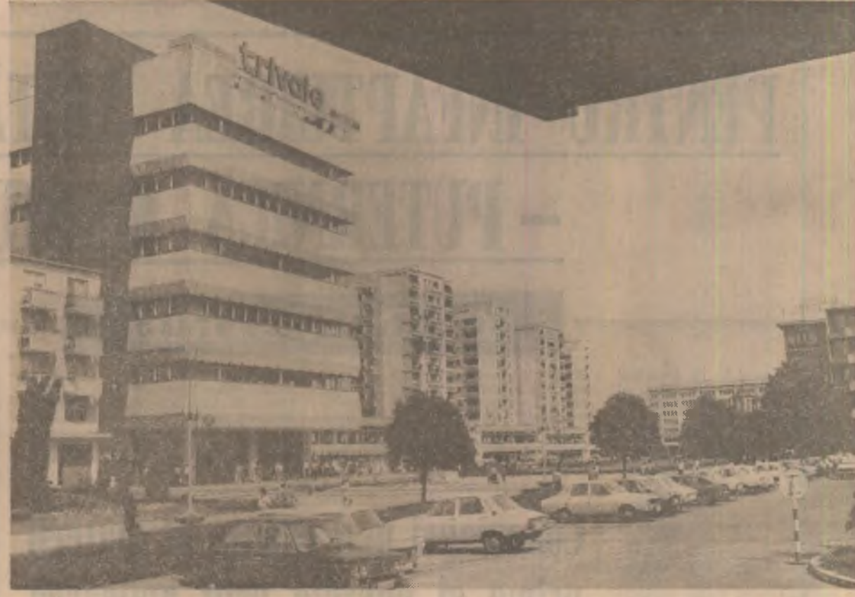
Frumosul centru, reînnoit, al municipiului Pitești

Cu hotărârea fermă de a îndeplini ritmic sarcinile de plan, strălucit realizând direcția organizării superioare a producției, îmbunătățirii indicelui de folosire a timpului de lucru și utilajelor, oamenii muncii din industria județului Bihor înscriu în amplă întrecere socialistă succese de prestigiu, livrînd suplimentar însemnate cantități de produse de primă importanță pentru economia națională. În perioada care a trecut din acest an, minerii au extras peste prevederi din subteran și cariere 82 mil tone lignit, energeticienii au realizat peste sarcina planificată 242 milioane kWh energie electrică pe bază de cărbune, petrolistii au produs peste cotele stabilite mai bine de 100 milioane mc gaze libere și asociate, precum și aproape 500 tone uleiuri minerale. S-au livrat, de asemenea, în plus, 3.700 tone alumina, produse de mecanică fină în valoare de 6,7 milioane lei, mașini-unelte în valoare de aproape 26 milioane lei, confecții textile în valoare de peste 200 milioane lei. Toate aceste sporuri au fost obținute în principal pe seama creșterii productivității muncii. Cu cele mai bune rezultate se prezintă colectivele de la „Electrocentrala” Oradea, Întreprinderea minieră Volvoizi, Întreprinderea de confecții și Întreprinderea „Infrățirea” din Oradea. (Ioan Laza, corespondentul „Științei”).