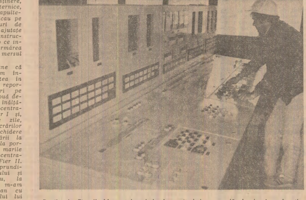
Porțile de Fier II. Momentul probelor la pupitul de comandă al ecluzei românești

ne metri cubi de beton de diferite mărci. Armatura metalică folosită pentru consolidarea obiectivului depășește 75.000 tone oțel. Lucrările de protejare a malurilor și albiei au impus folosirea a aproape 400.000 metri cubi piatră de carieră. Hidroagregatele, împreună cu celelalte utilități și instalații, însumează 50.000 de tone. Toate materialele și utilajele de mai sus au fost puse zi de zi în operă de către constructorii, cu vizuina întregului din fața, cu arderea patriotică, lăunul construcției fiind în ultimă instanță tocmai elanul lor revoluționar pus în slujba patriei și partidului. Cu demnitate și mîndrie au raportat realizările lor Congresului XIII, secretarul general al partidului, tovarășul Nicolae Ceaușescu, inițiatorul programului cuceritor de independență energetică a țării.