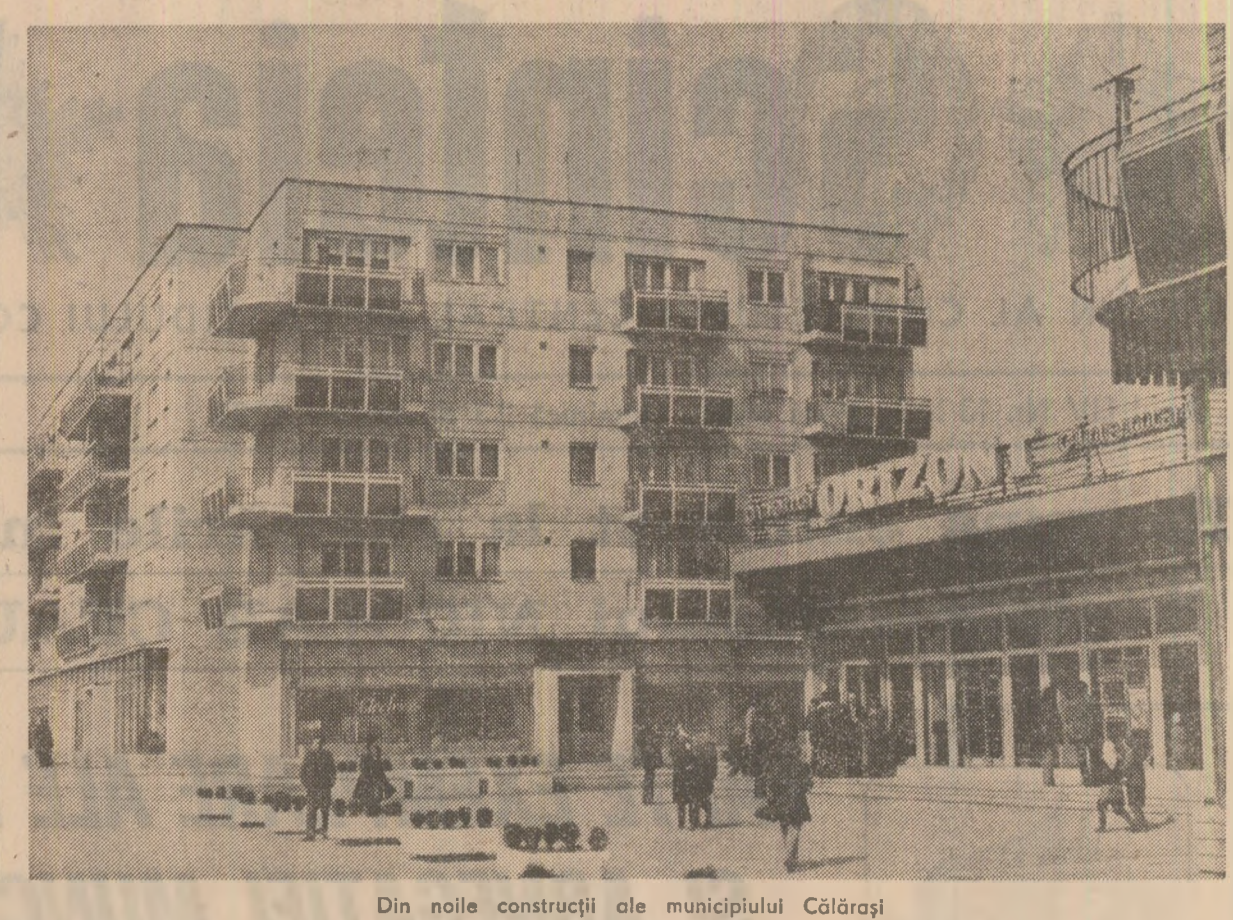
În noile construcții ale municipiului Călărași