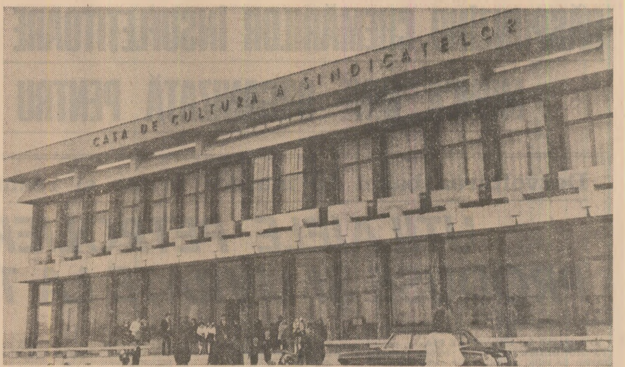
Casa de cultură a sindicatelor din municipiul Gh. Gheorghiu-Dej