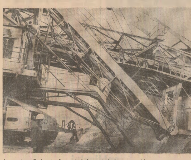
La cariera Berbești, din cadrul Întreprinderii miniere Horezu, se muncște intens pentru obținerea unor cantități tot mai mari de cărbune.

produse noi, de înaltă tehnicitate. De la Întreprinderea „Electrotimis” din Timișoara, unitate reprezentativă a industriei noastre electrotehnice și de mașini-unelte, situată pe primul loc în întrecerea socialistă pe ra-