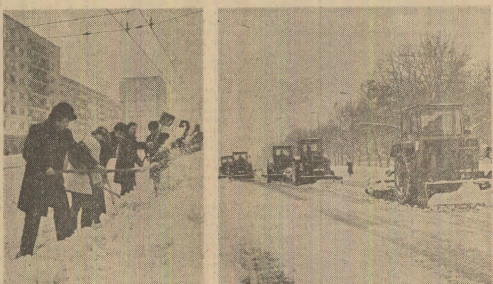
Pe toate străzile principale din București s-a intervenit decis, prompt, eficient, atât cu utilaje, cât și cu lăpeșii, pentru restabilirea condițiilor normale de circulație.

Ninsorea abundentă și viscolul din cursul nopții de marți spre miercuri au determinat luarea unor măsuri energetice în CAPITALĂ pentru asigurarea desfășurării normale a circulației, a întregii activități economice și sociale. Sub îndrumarea comandamentului special constituit pentru organizarea și conducerea lucrărilor de dezzăpezire, au acționat peste 1.000 de utilaje specializate — care, alături de artele principale ale municipiului. O atenție deosebită a fost acordată degajării căilor de acces spre platformele industriale, depozitele de materii prime pentru unitățile industriale, de mărfuri agro-alimentare, fabricile de pine și de produse lactate, unitățile comerciale, ca și a arterelor de penetrație în Capitală și drumurilor de centură. Ca urmare a măsurilor luate în cursul nopții pentru înlăturarea zăpezii de pe principalele trasee ale mijloacelor de transport în comun, a fost asigurată deplasarea cetățenilor spre locul de muncă, aprovizionarea unităților comerciale din toate cartierele. În același timp, zeci de mii de oameni ai muncii din întreprinderi și instituții, precum și elevi și studenți, militari, împreună cu lucrătorii administrației domeniului public, au participat la înlăturarea zăpezii de pe partea carosabilă a arterelor de circulație, la degajarea intersecțiilor și a stațiilor mijloacelor de transport în comun.