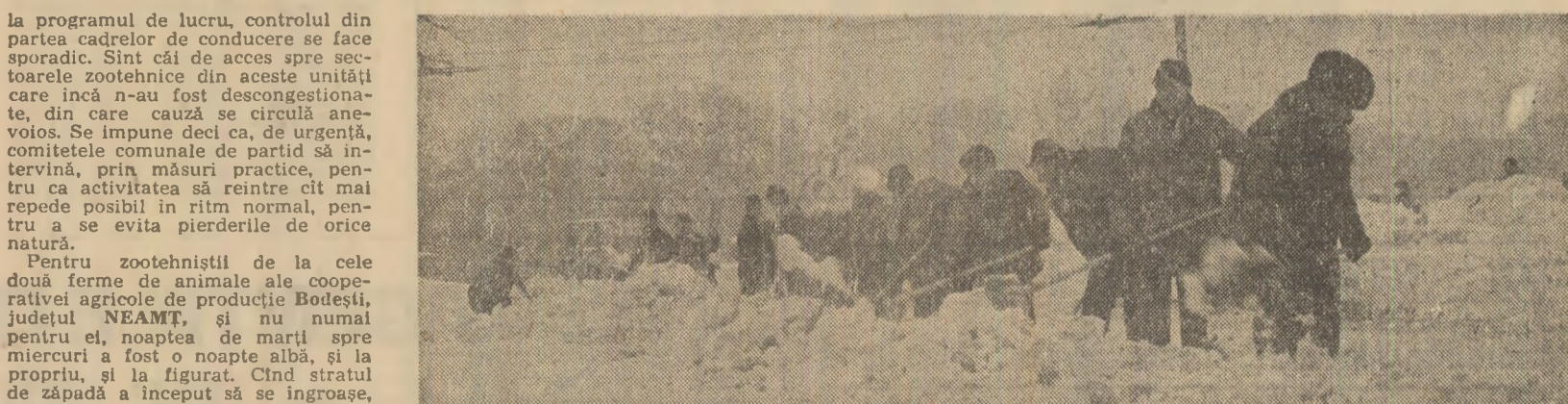
Acțiune energică în Capitală, pentru degajarea de zăpadă a arterelor de circulație. În imagine: la primărie ore ale zilei de ieri, în Piața Școlii

Există, din păcate, și astfel de exemple. În unele cooperative agricole din același județ - Breznita de Motru, Jiana, Malovăț, Brosteni și Vinuțel - furajele ajung cu întârziere în grajdurile cu animale, unii îngrijitori vin cu întârziere