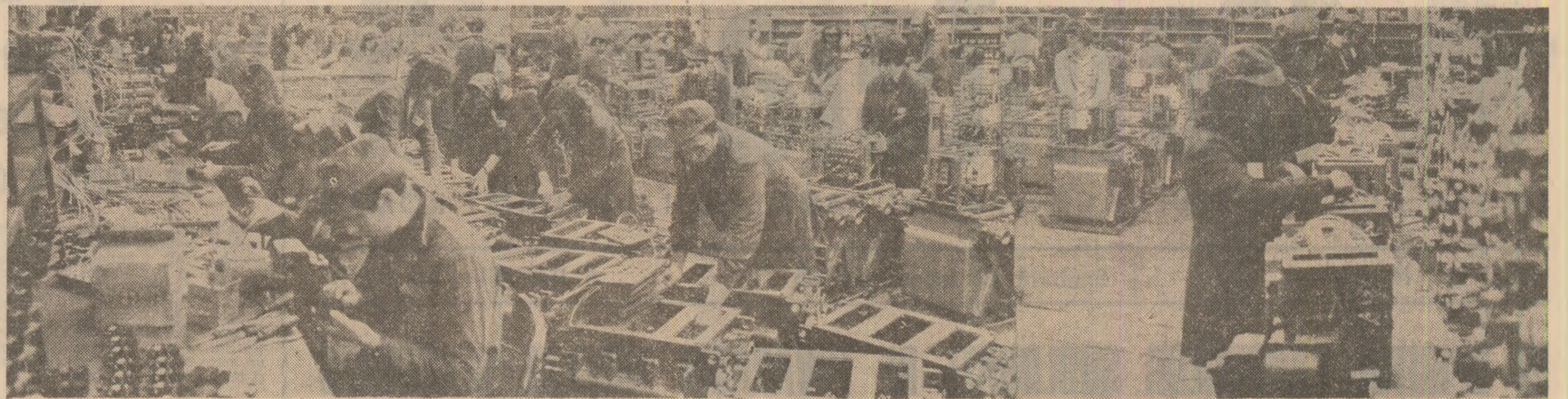
În aceste zile de început de an, la întreprinderea „Electrocontact” din Botoșani se acționează cu toate forțele pentru îndeplinirea ritmică a sarcinilor de plan la producția fizică. În fotografie: aspect din secția de montaj general