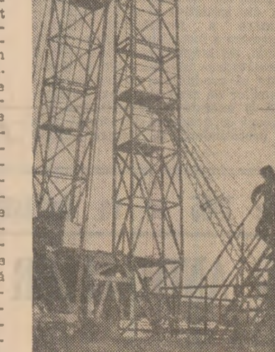
Fluידele de foraj, la care s-au înregistrat rezanțe în livrări.

teniv. În fine, s-a asigurat și întărit asistența tehnică în toate schimbările, pînă la cele mai îndepărtate sonde, pentru a se putea realiza un ritm intens de lucru și în lunile de iarnă. Măsurile tehnice și organizatorice luate de conducerea schelei sînt însoțite în aceste zile de o activitate politică intensă. Organizațiile de partid, de sindicat și de tineret popularizează, prin toate mijloacele muncii politice de masă, experiența sonderilor frunțosi. La gazețele de perete ale brigăzilor s-au afixat articole în care se arată cum trebuie acționat pentru ca inițiativa „Toate sondele destinate producției — finalizate înainte de termen” să fie îndeplinită întotdeauna. Peste tot, la sonde, în atelier, muncitorii, inginerii și tehnicienii din Zemeș depun eforturi susținute pentru a grăbi ritmul de foraj, pentru a contribui din primele zile ale anului la sporirea producției de țifet. Ritmurile tot mai mari de foraj pe care și le-au propus sonderii schelei în acest an vor trebui desigur susținute mai bine decît anul trecut și de furnizorii de sapa, prăjini de foraj, echipament pentru pompe, substanțe pentru tratarea