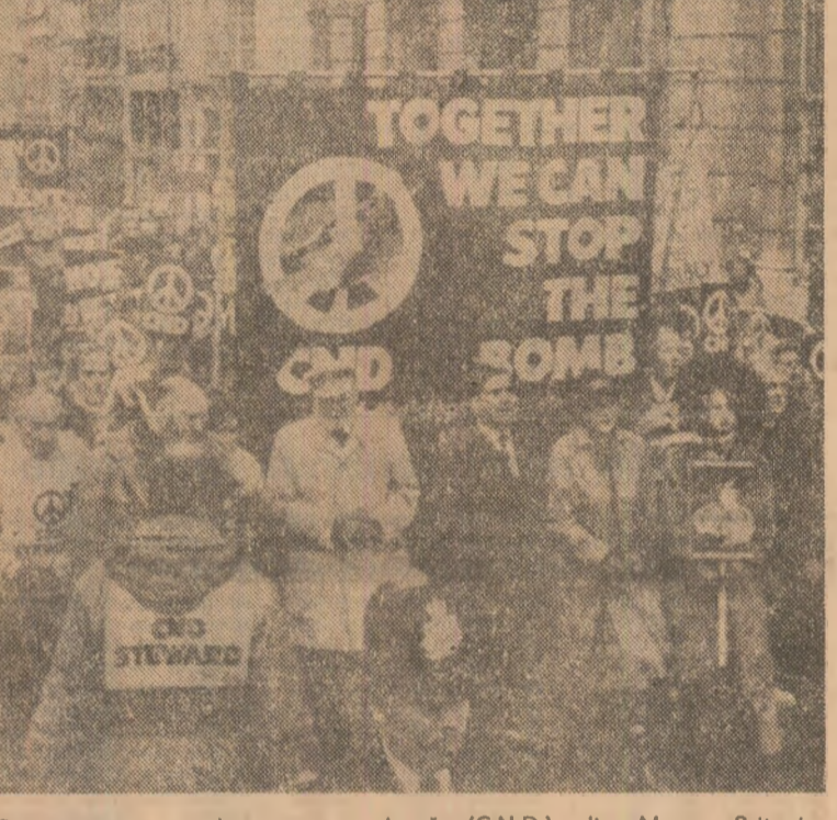
Compania pentru dezarmare nucleară (C.N.D.) din Marea Britanie, mișcare ce cuprinde 1 400 de grupuri din care fac parte aproape 400 000 de persoane, își continuă acțiunile pentru oprirea amplasării noilor rachete și înlăturarea primejdiei nucleare