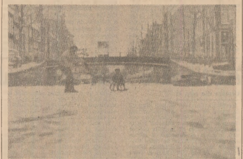
Ca și alte țări europene, Olanda cunoaște geruri nemaîntîlnite în ultimii ani. Celebrele canale ale Amsterdamului au înghețat pe întreaga lungime, devenind, așa cum se poate vedea și din imagine, un loc de promenadă