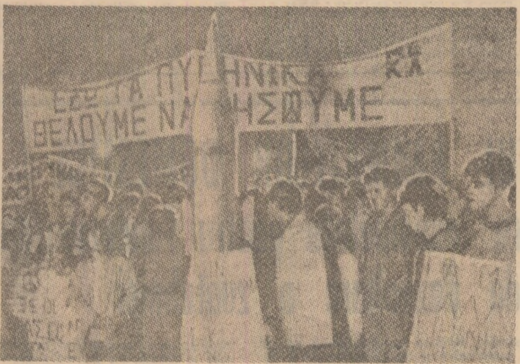
Mișcare pentru pace și dezarmare cuprinde largi sectoare sociale din Grecia. Fotografia înfățișează una din numeroasele demonstrații desfășurate la Pireu împotriva armelor nucleare