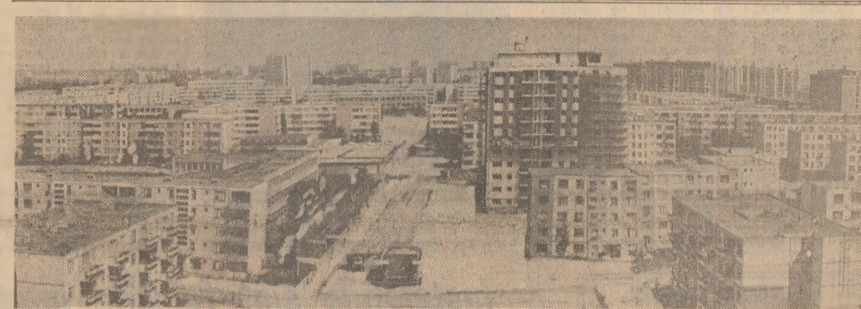
Municipiul Galați, ca de altfel toate orașele patriei, impresionează prin modernele sale construcții.

Avînd în vedere că complexitatea problemelor ridicate de edificarea noii societăți impune ca o necesitate obiectivă perfecționarea sistemului de organizare și conducere a economiei noastre, adaptarea permanentă a mecanismului econo-