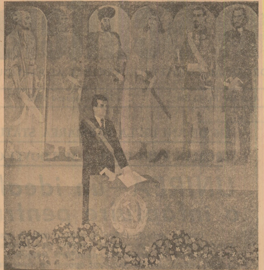
Lucrare de Constantin Piliuță