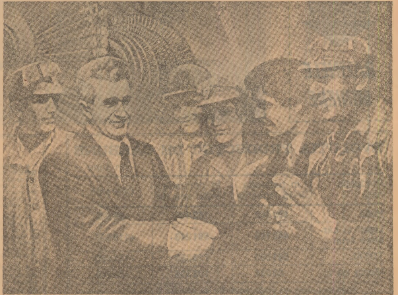
Lucrare de Vintilă Mihăiescu