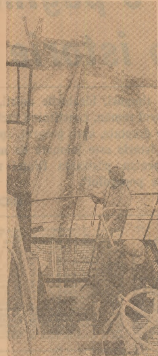
În condițiile acestei țări grele, la cariera Rovinari-Est, din bazinul carbonifer al Gorjului, oamenii sint mereu la datorie, pentru a folosi cu indici superiori utilajele din dotare.

Mai mult cărbune energetic, de bună calitate pentru termocentrale! — Iată un obiectiv major al acestor zile, de înfăptuire a căruia depinde, într-o măsură hotărîtoare, funcționarea la întreaga capacitate a termocentralelor, desfășurarea normală a activității productive și sociale. Cemați să răspundă prin fapte de muncă exemplară indicațiilor tovarășului Nicolae Ceaușescu, sarcinilor stabilite de Comitetul Politic Executiv al C.C. al P.C.R. pentru depășirea greutăților create de iarna neobisnuit de grea, minerii au în această perioadă înaltă îndatorire patriotică de a acționa neabătut, cu abnegație, cu elan revoluționar și înaltă răspundere pentru a spori zi de zi producția de cărbune, atât de necesar termocentralelor.