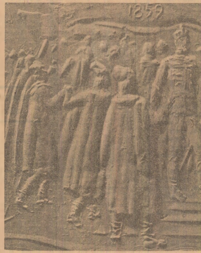
Lucrare de Gheorghe Adoc

„...În urmele Adunării electivă munteane au fost introduse 61 de buletine de vot, toate desemnînd ca domn al Țării Românești de la sud de Carpați