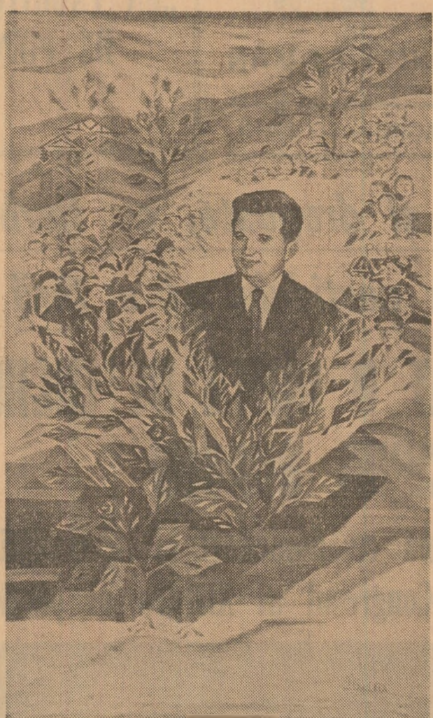
Tapiserie de Ileana Balotă