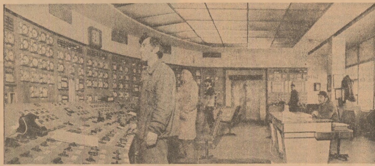
La termocentrala Paroseni, prin supravegherea cu maximă atenție a funcționării agregatelor și instalațiilor, s-a asigurat, în ultimele zile, o putere energetică de 200 MW

înaltă calificare. În toate cele trei schimburi de producție, a intensificării controloarelor preventive, pentru a evita orice oprire accidentală.” Responsabilitatea muncitorească, competența profesională sînt dovedite și de finalizarea înainte de termen a reviziei la cazanul nr. 2, a cărui repunere în funcțiune a echivalat la creșterea, în medie, cu 20 MW a puterii puse la dispoziția sistemului energetic național. Exploatarea la parametrii optimi a agregatelor a asigurat și joi depășirea cu circa 5 MW a puterii disponibile prevăzute. 2. O situație deosebită s-a creat prin sosirea a 172 vagoane cu cărbune din bazinul carbonifer al Olteniei. Acestea au venit fără program de transport și fără a fi acceptate de beneficiar, contrar măsurilor stabilite în comun de Ministerul Energiei Electrice, Ministerul Minelor și Ministerul Transporturilor și Telecomunicațiilor. Deși s-au concentrat foarte sporadic în gospodăria de cărbune, ritmul descărcării nu depășește 8000 tone pe zi, cărbunele, dincolo de calitatea sa scăzută, fiind și amestecat cu zăpadă. Pe scurt, este vorba de o im-