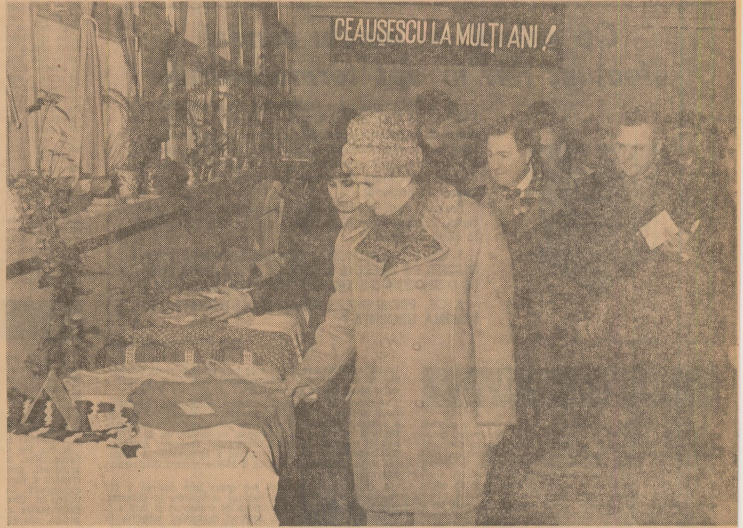
Pe întreg parcursul vizitei, momente emoționante, de aleasă stimă și prețuire față de cel mai iubit fiu al poporului, tovarășul Nicolae Ceaușescu