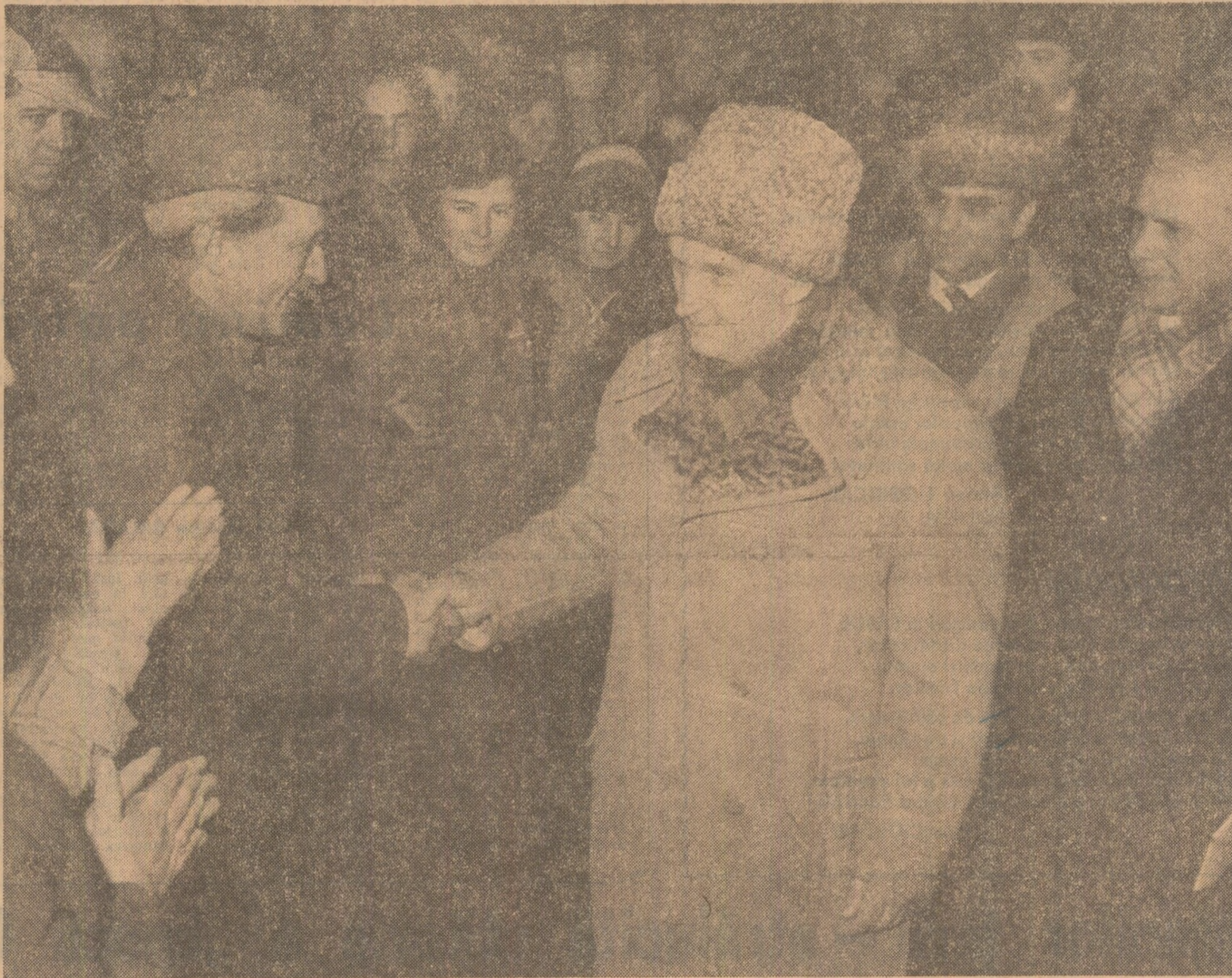
Cu toată căldura inimii, sintetizînd sentimentele întregului popor, iubitelui conducător — tradiționala urare „La mulți ani!”

Vizita de lucru a secretarului general al partidului, președintele Republicii, are loc într-unul dintre cele mai puternice centre industriale ale țării. Asemenea tuturor județelor patriei, Brașovul a cunoscut, în ultimele două decenii, o dezvoltare puternică pe toate planurile, ca urmare a politicii partidului, a concepției novatoare, de largă cuprindere și perspectivă promovată cu clarviziune și fermitate revoluționară de Partidul Comunist Român, de secretarul său general, tovarășul Nicolae Ceaușescu. Potențialul industrial al județului și bogățiile sale tradiții muncitorești au fost valorificate la un nivel superior, economia sa a înregistrat o puternică diversificare, îndeosebi în domeniul ramurilor de vîr, purtătoare ale progresului tehnic, ceea ce a făcut ca Brașovul, principalul furnizor de tractoare, autocamioane, coloranți, pigmenți organici, motoare, rulmenți, să ocupe, din punctul de vedere al producției industriale, locul al doilea pe țară.