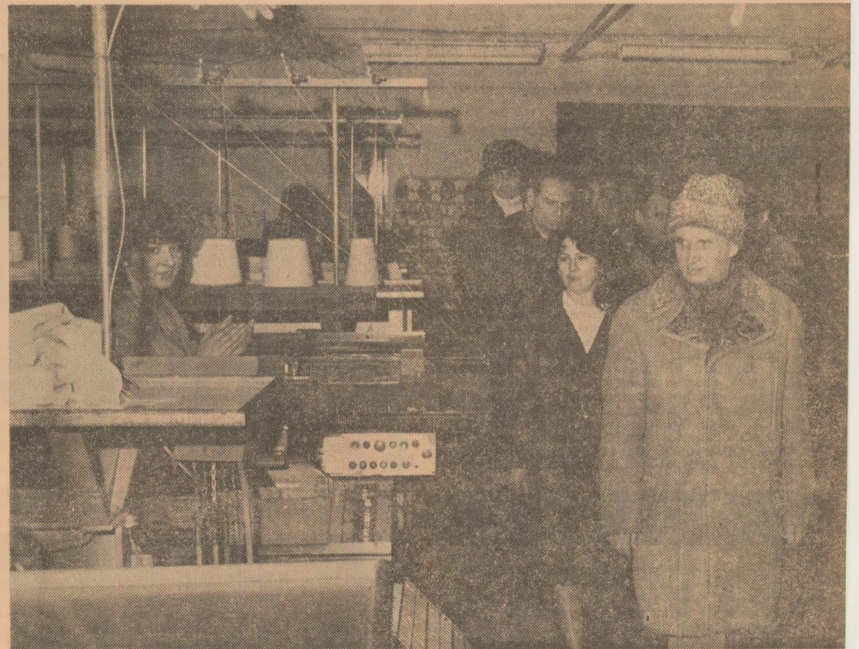
La Întreprinderea de tricotate

Sub semnul acestor sentimente, exprimate vibrant, cu căldură de oameni muncii din cele două reprezentative unități industriale ale Brașovului, s-a încheiat vizita de lucru a tovarășului Nicolae Ceaușescu, care a prilejuit o amplă analiză a modului în care se acționează, încă din primele zile ale acestui an, pentru îndeplinirea în cele mai bune condiții a prevederilor de plan pe 1985 și pe întregul cincinal, pentru îndeplinirea hotărârii adoptate de cel de-al XIII-lea Congres al partidului.