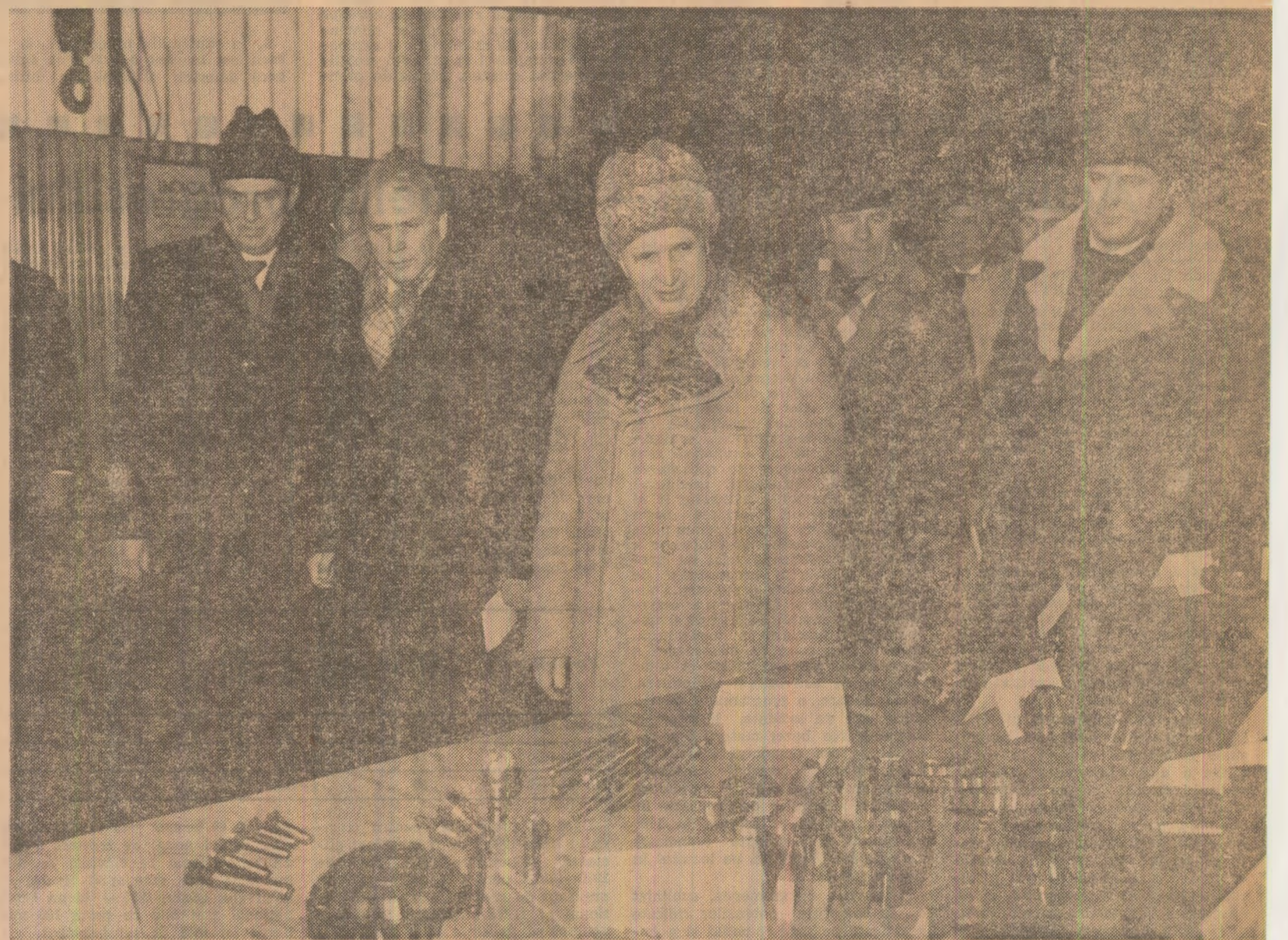
La întreprinderea „Tractorul”