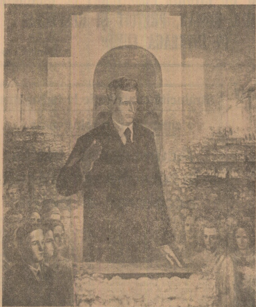
Pictură de Ion Șulea-Gorj