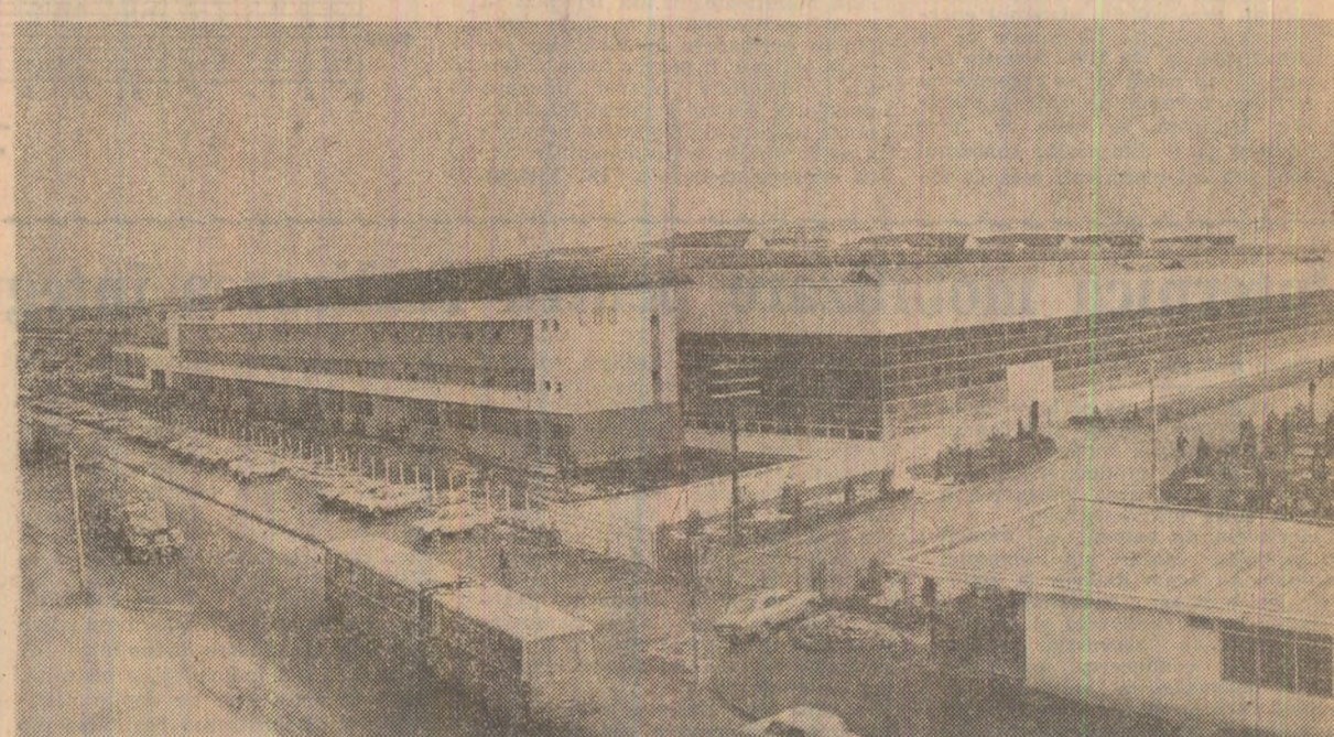
Combinatul de utilaj greu din Cluj-Napoca, una dintre temelile moderne ale dezvoltării străvechului municipiu