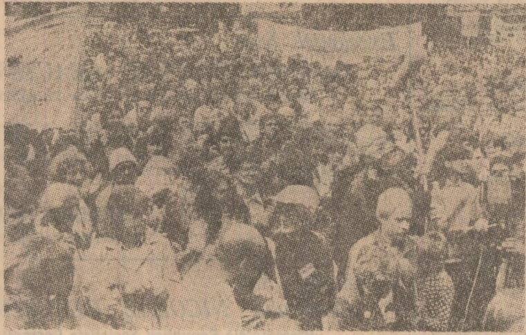
La Copenhaga s-a desfășurat recent o amplă demonstrație în cursul căreia participanții s-au pronunțat pentru adoptarea de măsuri eficiente menite să ducă la înlăturarea primejdiei nucleare

în deplină față de propunerile privind crearea de zone denuclearizate în Europa, inclusiv în nordul continentului. Plenara C.C. al P.C. Finlandez a condamnat, totodată, intensificarea cursei înarmărilor.