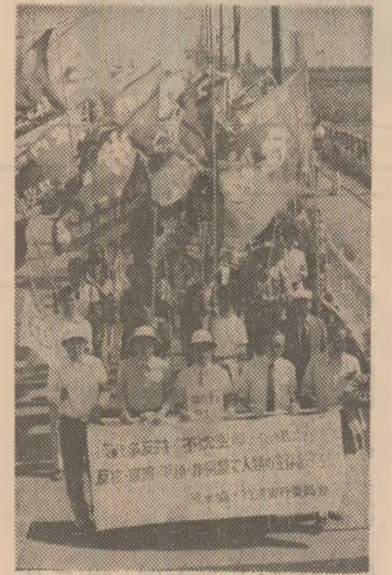
Demonstrația la Tokio (Japonia) sub lozincă „Niciodată o nouă Hiroshimă!”

Înghețarea arsenalelor nucleare și trecerea la reducerea lor.