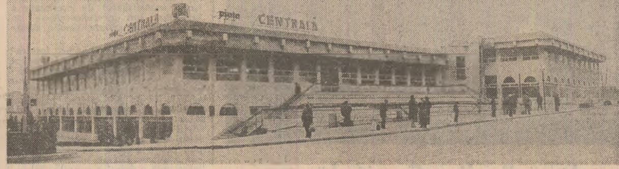
Noua piață centrală din Tirgu Jiu.

Mihail GRIGOROSCUA corresponsentul „ȘciŢteii”