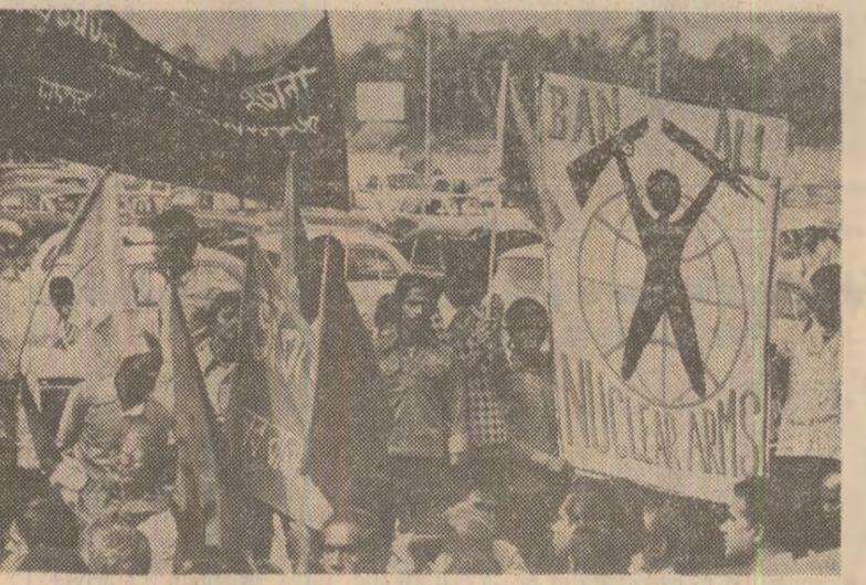
La New Delhi (India) a avut loc o amplă demonstrație, în cadrul căreia s-a cerut interzicerea definitivă a tuturor armelor nucleare

Într-o zonă lipsită de arme nucleare, în care să fie interzisă păstrarea, stocarea și experimentarea unor asemenea arme. Ca expresie a voinței tot mai clar exprimate a opiniei publice neozelandeze, premierul David Lange a reafirmat poziția față de accesul în porturile țării al navelor militare propulșate cu energie nucleară sau dispunînd de arme nucleare — pentru această atitudine fiind, deabel, propus drept candidat la Premiul Nobel pentru pace pe 1985.