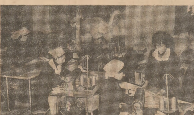
Un mobilizator angajament al colectivului întreprinderii de confecții din Craiova

pectă disciplina de producție, stabilind pe loc măsuri concrete pentru prevenirea și eliminarea risipei de materiale, pentru respectarea strictă a disciplinei tehnologice.