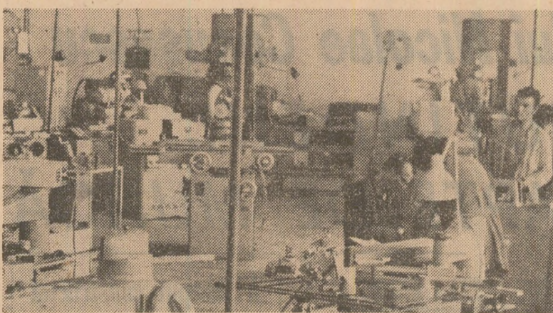
La Întreprinderea mecanică din Bacău, principala direcție de acțiune — creșterea productivității muncii

Gheorghe BALTA correspondentul „Scintei”