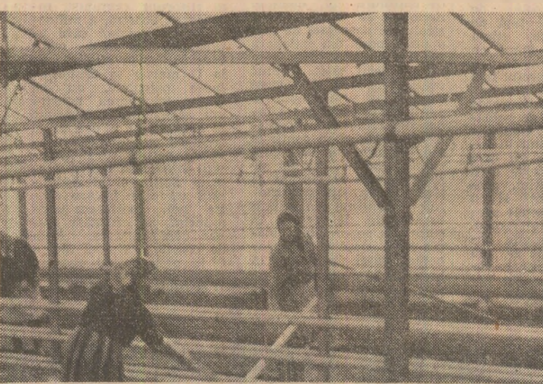
Citeva concluzii desprinse din adunarea generală a cooperativilor de la C.A.P. Furculești, județul Telemorman

avem o avere mare, pămînt bun, care acum, cînd îl putem și iriga, poate rodi de două ori mai mult decît am recoltat anul trecut. Să-l lucrăm însă cum trebuie, iar pentru asta e nevoie să vină toți la muncă”. „Nu este o cinste pentru noi să vădă cineva că la o fermă a C.A.P.