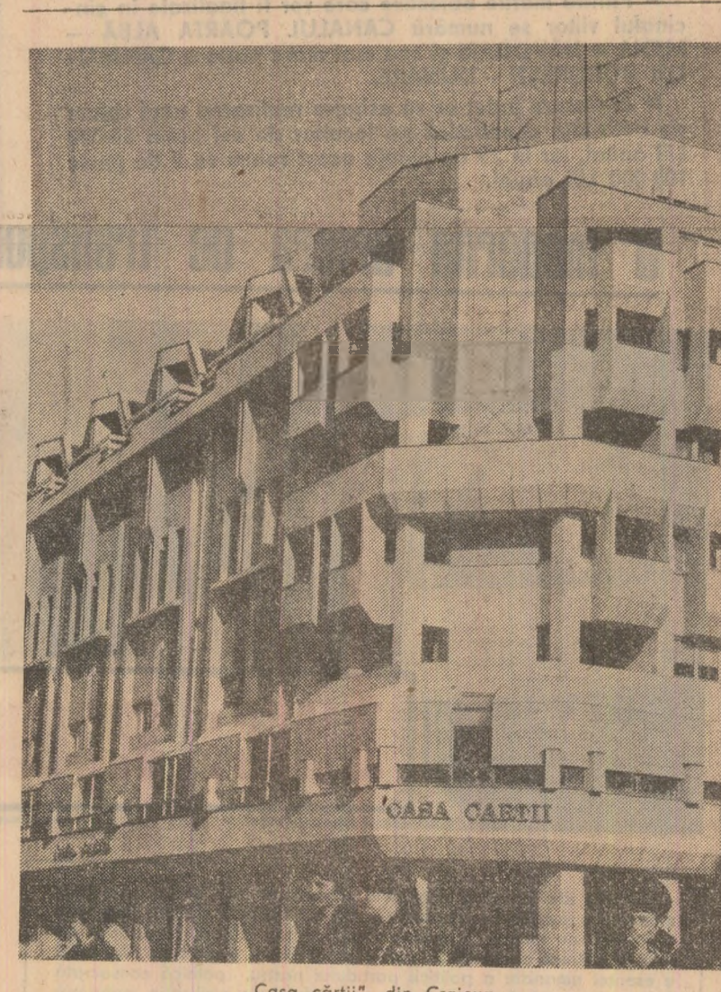
„Casa cărții”, din Craiova.

Vasile BERHECI județului, Ocnele silvice Mălini, județul Suceava