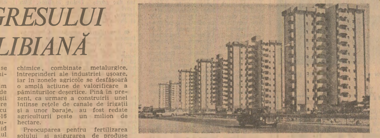
Vedere din Tripoli: cunoscutul complex edilitor „Colina verde”, rod al concurenței dintre constructorii libieni și libieni