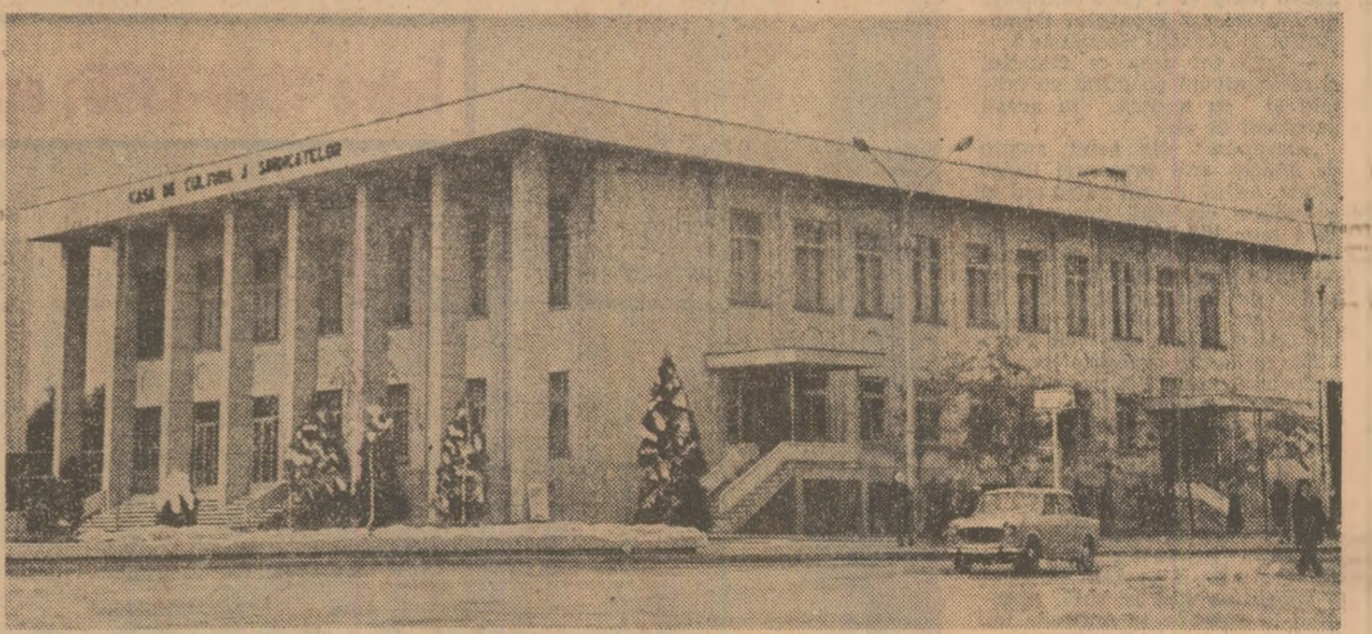
Imaginedin Birlad: casa de cultură a sindicatelor

Poporul nostru întîmplînd ziua de 9 Mai — Ziua victoriei asupra fașismului, Ziua independenței României — într-o atmosferă de puternic avînt eroic, acționînd strîns unit în jurul partidului și secretariatului său general, tovarășul Nicolae Ceaușescu, pentru transpunerea în viață a istoricelor hotărîri adoptate de Congresul al XIII-lea al partidului, pentru îndeplinirea neabătută a politicii interne și externe a partidului și statului nostru.