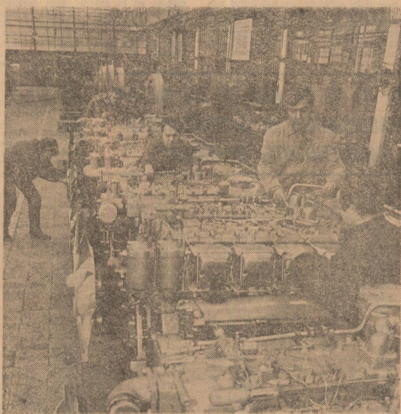
Oamenii muncii de la Întreprinderea „23 August” din Capitală întâmpină alegerile de deputați de la 17 martie cu noi și importante succese...