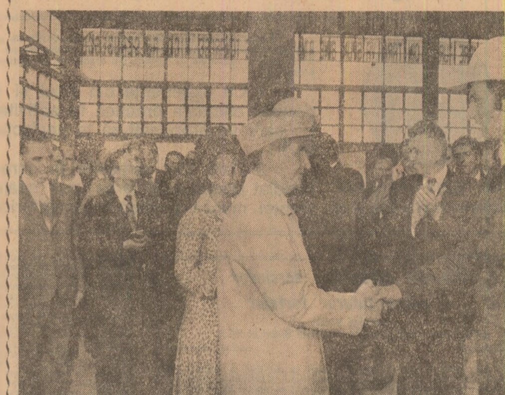
6 AUGUST 1980, Tovarășul Nicolae Ceaușescu, împreună cu tovarășa Elena Ceaușescu, sint întâmpinați, ca pretutindeni pe cuprinsul țării, cu entuziasm și aleasă stimă de siderurghii gălățeni...