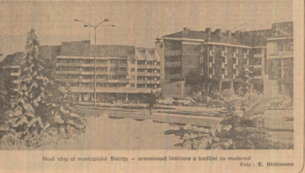
Noul chip al municipiului Bistrizia — armonioasă îmbinare a tradiției cu modernul.

Nicolae Ceaușescu, punea bazele politicii de dezvoltare armonioasă a țării. „Bistrizia va crește din punct de vedere industrial asemenea lui Făt-Frumos care creștea într-o lundă și alții într-un an” — roșea glasul estelui întregii țări. Uriașul efort de investiții al poporului întreg a făcut din județul altădată rîmas în urmă un adevărat Făt-Frumos, plăcîndu-și pe orbita dezvoltării generale a patriei. Dacă în cincinalul 1968-1970 investițiile alocate le egalau pe cele din 20 de ani precedenți (1 241 000 000 lei), numai în primii patru ani ai actualului cincinal au fost realizate investiții de peste 9 000 000 000 lei. Laurentiu DUTA Gheorghe CRIȘAN, corespondentul „Scintei” (Continuare în pag. a V-a)