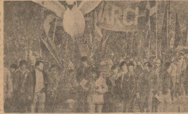
Imaginea de la una din marile demonstratii antirazboinice din Copenhaga, desfasurata sub semnul unitatii de lupta a tuturor fortelor social-politice care se pronunta impotriva pericolului nuclear