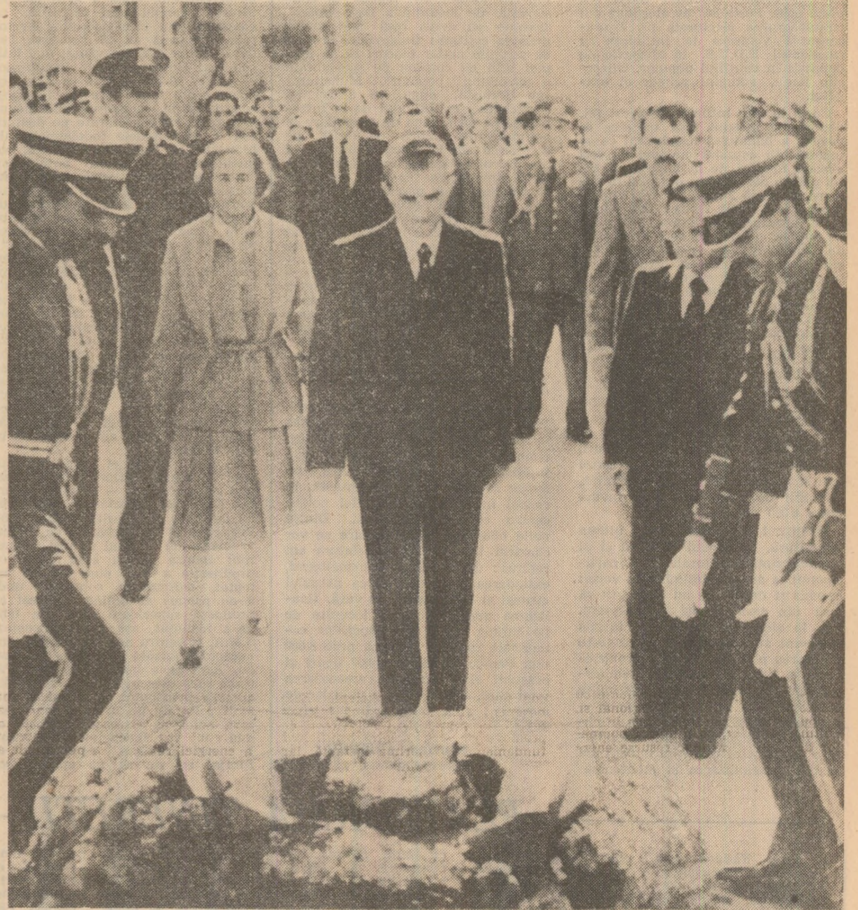
TRIPOLI 5 (Agerpres). — Marți dimineață, președintele Republicii Socialiste România, tovarășul Nicolae Ceaușescu, împreună cu tovarășa Elena Ceaușescu au depus o coroană de flori la Monumentul martirilor de la Hani, care evocă eroismul luptelor din octombrie 1911 împotriva armatelor italiene coloniale. Monumentul a fost ridicat în 1980

Tovarășul Nicolae Ceaușescu, împreună cu tovarășa Elena Ceaușescu au depus o coroană de flori la Monumentul martirilor de la Hani