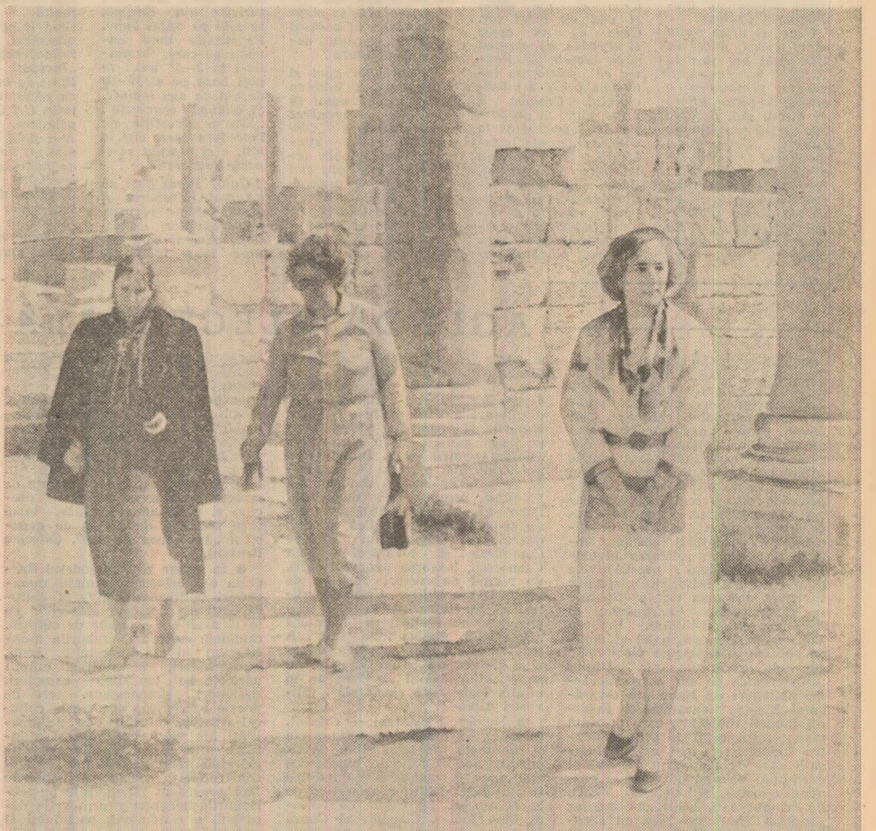
Tovarășa Elena Ceaușescu a vizitat, în cursul dimineții de marți, vestigiile feniciene și greco-romane ale orașului antic Sabratha. Gazdele, în frunte cu inspectorul general al monumentelor arheologice, au exprimat cu căldură to-