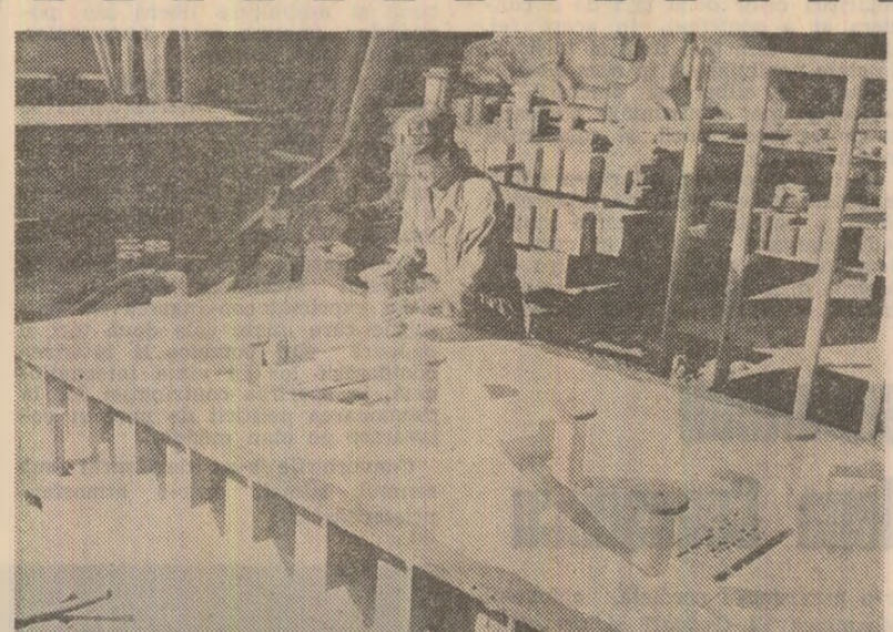
Instalația de turnare a pieselor în forme vidate, aflată în funcțiune la Întreprinderea „Vulcan” din Capitală, își demonstrează din plin marea sa eficiență economică

bune de lucru celor care muncesc în asemenea sectoare: ● Generalizează o reducere cu 70 la sută a consumului de energie electrică și cu aproape 85 la sută a celui de gaz metan; ● Se realizează o diminuare aproape totală a consumului de hîniși și de amestecuri de formare; ● Pe 200 mp suprafață productivă, întreprinderea bucuresteană realizează cu instalația de turnare în forme vidate circa 200 tone de piese pe lună, care prin procedul clasic ar necesita o suprafață de cinci ori mai mare.