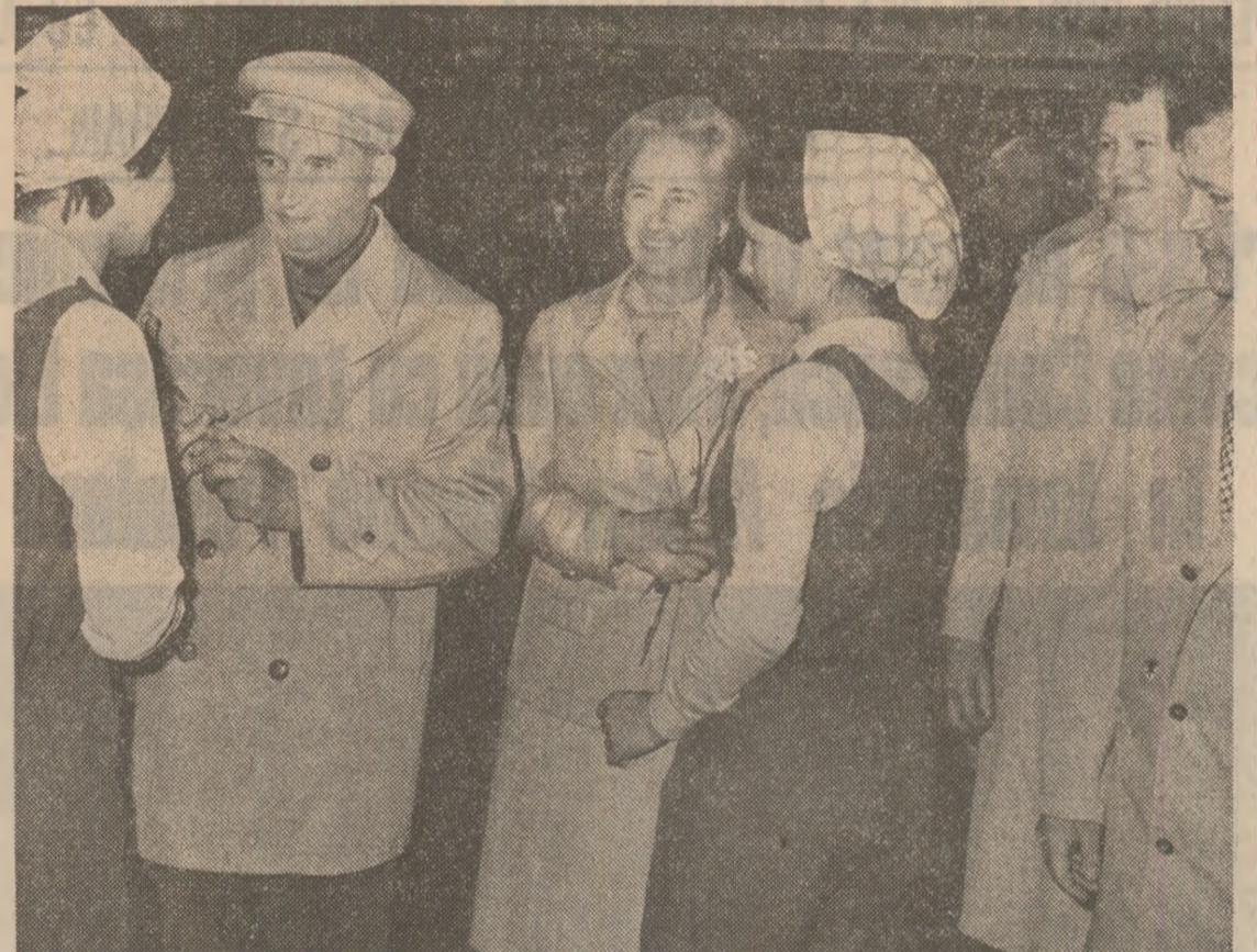
2 IULIE 1982: Tinere reprezentante ale tinerei și viguroasei industriei sucevene oferă flori ale dragostei și recunoștinței - gest devenit simbol de fiecare dată cind tovarășul Nicolae Ceaușescu, tovarășa Elena Ceaușescu se află în mijlocul colectivelor muncitorești