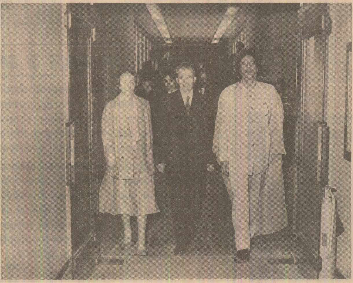
Înaintea semnării documentelor româno-libiene

Miercuri, 6 martie, a luat sfârșit vizita oficială de prietenie pe care tovarășul Nicolae Ceaușescu, președintele Republicii Socialiste România, și tovarășa Elena Ceaușescu au efectuat-o în Jamahiriya Arabă Libiană Populară Socialistă, la invitația colonelului Moammer El Gaddafi, conducătorul Marii Revoluții de la 1 Septembrie.