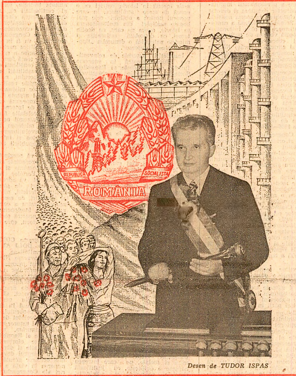
Desen de TUDOR ISPAS