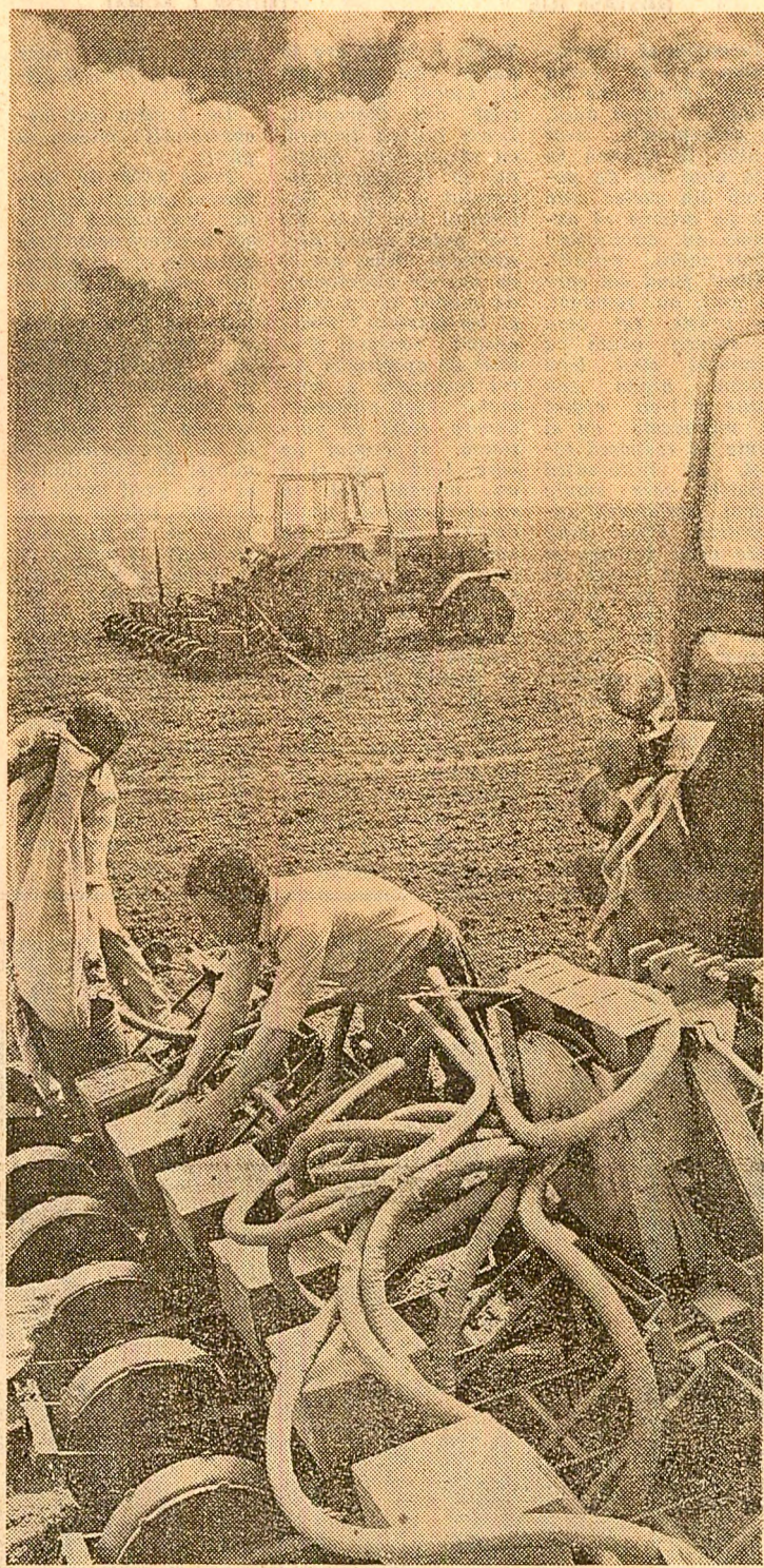
La semănat, lucrări de cea mai bună calitate pe terenurile C.A.P. Cetatea, județul Giurgiu

În județul Giurgiu — fapte, atitudini, preocupări care vorbesc despre