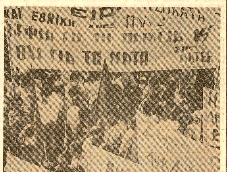
In fotografie: Moment din timpul unei manifestații desfășurate în orașul grec Patras împotriva cursei înarmărilor nucleare, pentru pace

OSLO 18 (Agerpres). — Norvegia este prima țară membră a N.A.T.O. care a anunțat că nu va participa la programul american cunoscut sub numele de „războiul stelelor”, informându-și agenția Reuters. „Guvernul apreciază că nu este oportun ca Norvegia să participe la programul militar de cercetări privind armele spațiale al S.U.A.”, se arată într-o declarație a Ministerului Afacerilor Externe adresată Comitetului pentru afaceri externe al parlamentului. Documentul pune în evidență temerarea Norvegiei că dezvoltarea unor noi sisteme strategice defensive ar putea duce la o cursă a înarmărilor în spațiu, care trebuie evitată.