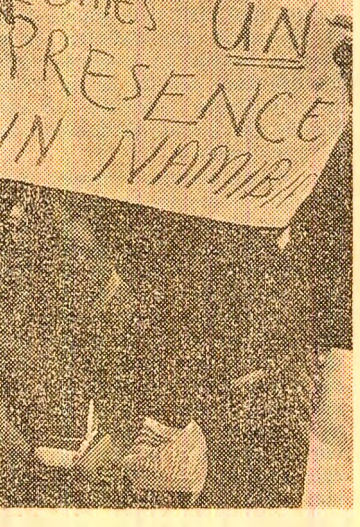
Eforturile depuse de comunitatea internațională...