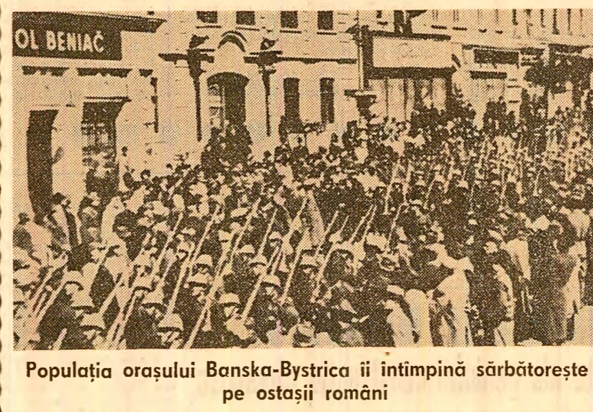
Populația orașului Banská-Bystrica îi întâmpină sărbătorește pe ostașii români