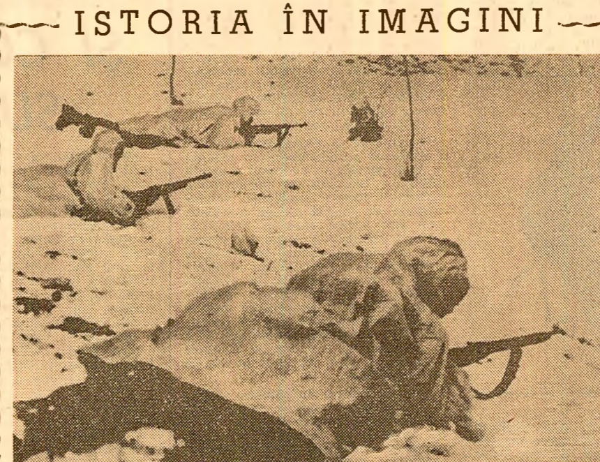
Militari români în misiune de luptă