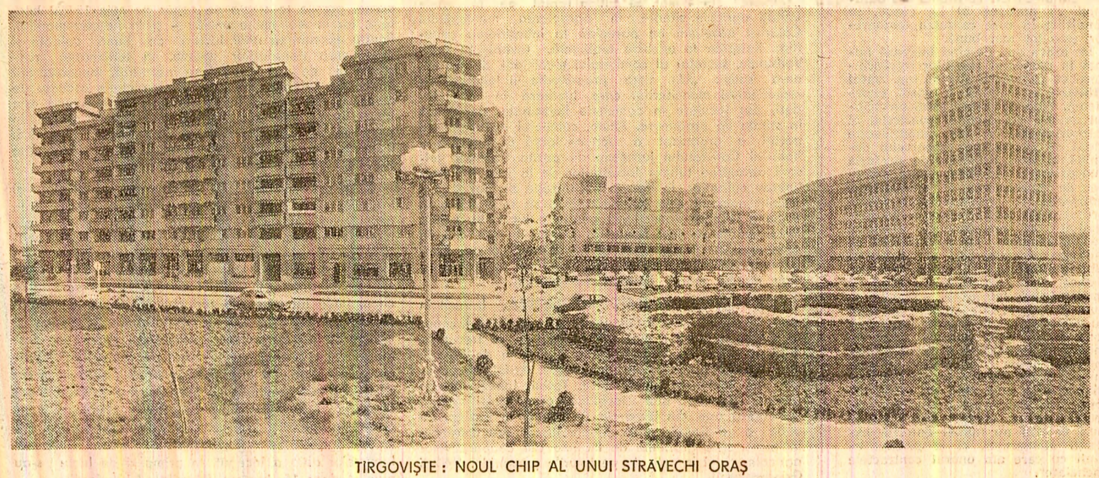
TIRGOVIȘTE: NOUL CHIP AL UNUI STRĂVECHI ORAȘ