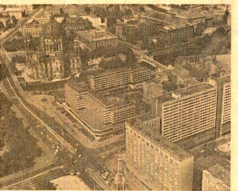
Tradiție și modernitate la Berlin, capitala R. D. Germane

Sondershausen este o localitate de mineri cu peisaj industrial specific: imaginea instalațiilor de aspirație, a liniilor ferate ramificate pe care așteaptă platforma metalice completate de geometria complicată a conductelor ce împingez un relief abia ondulat, pe care, distanțat, se ridică dealuri de sticlă. Cîteva sate mine de extracție a potasiului, împreună cu instalația de prelucrare, centrala electrică și coloniele de locuințe formază, în această zonă, un tot unitar.