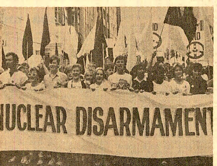
UCLEAR DISARMAMENT. În Australia se extinde mișcarea împotriva cursei înarmărilor...

Simpozion internațional cu tema „Educația pentru pace”