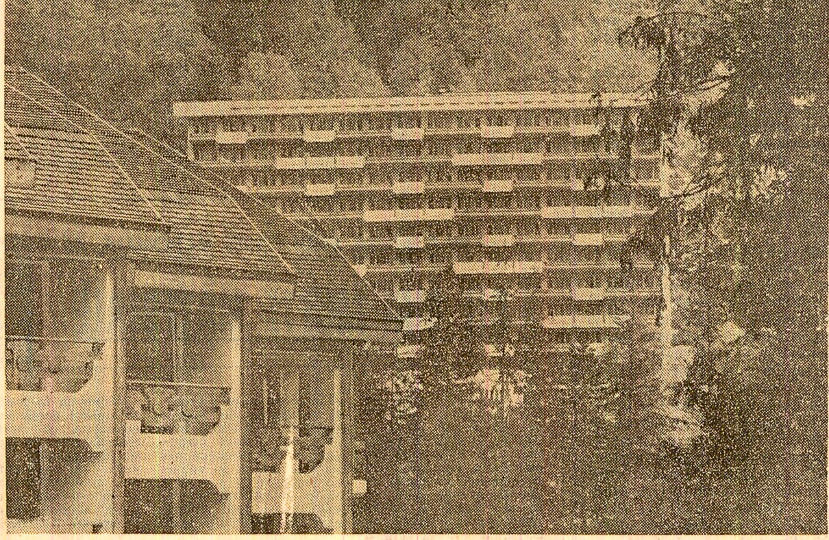
Ilustrată din frumoasa stațiune Slănic-Moldova

Noutăți de sezon și în ceea ce privește petrecerea timpului liber. Ediliile stațiunii au amenajat noi locuri de recreare, terenuri de sport, o stină turistică. La casa de cultură își desfășoară activitatea un teatru popular cu stațiune permanentă, un cinematograful, o bibliotecă și un club. Prezintă, de asemenea, spectacole colective Teatrului dramatic „Bacovia” și Orchestra simfonică din Bacău, precum și ansamblul folcloric „Doina Trosului”. (Gheorghe BALTA, corespondentul „Scintei”).