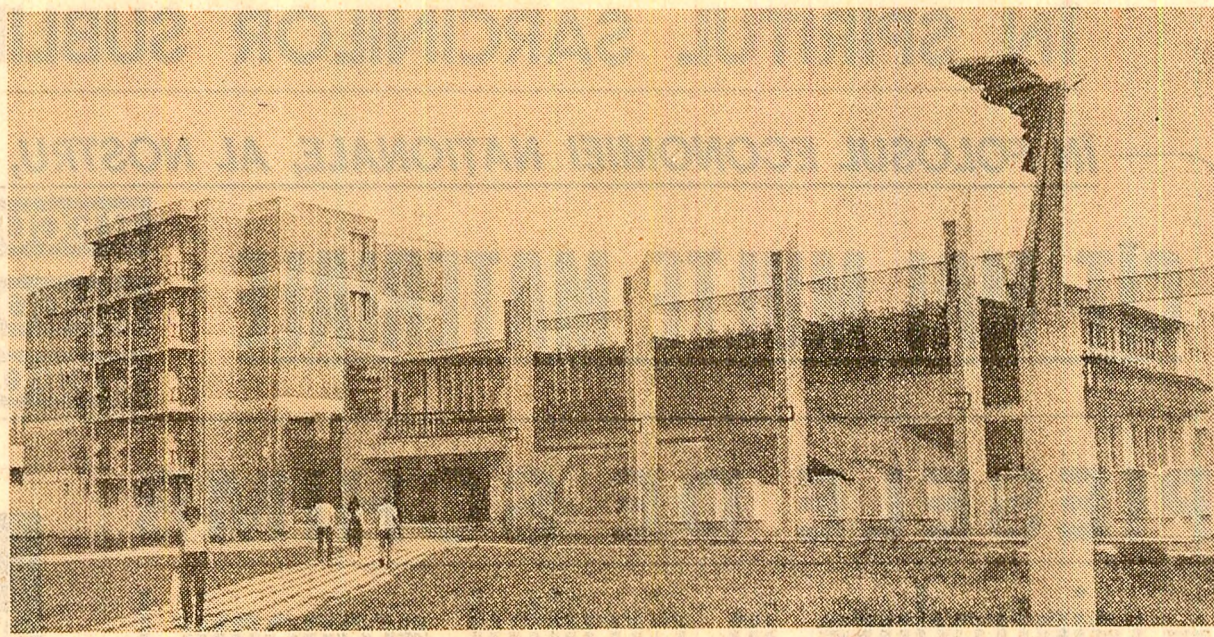
Casa de cultură a științei și tehnicii pentru tineret din Buzău

— Ce discută adeseori despre trecut și despre prezentul teatrului. Nu întodeuna cu aceeași acuitate despre viitorul teatrului. Izvorul inspirației creatorilor de artă a fost, este și va fi schimbarea, transformările ce se produc în societate și în viața oamenilor. Dacă, prin absurd, lumea nu s-ar schimba, dacă, prin absurd, omul nu se arăta altfel decât el a fost, ar fi oare posibil să scrie o literatură care să reflecte această schimbare? Dacă, prin absurd, omul nu se arăta altfel decât el a fost, ar fi oare posibil să scrie o literatură care să reflecte această schimbare? Dacă, prin absurd, omul nu se arăta altfel decât el a fost, ar fi oare posibil să scrie o literatură care să reflecte această schimbare?