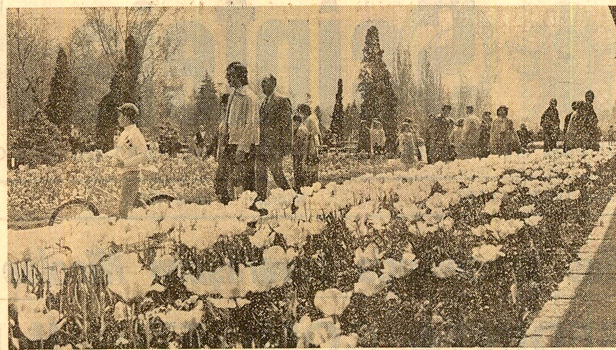
Parcurile - loc de agrement, de relaxare într-un sănătos mediu ambiant