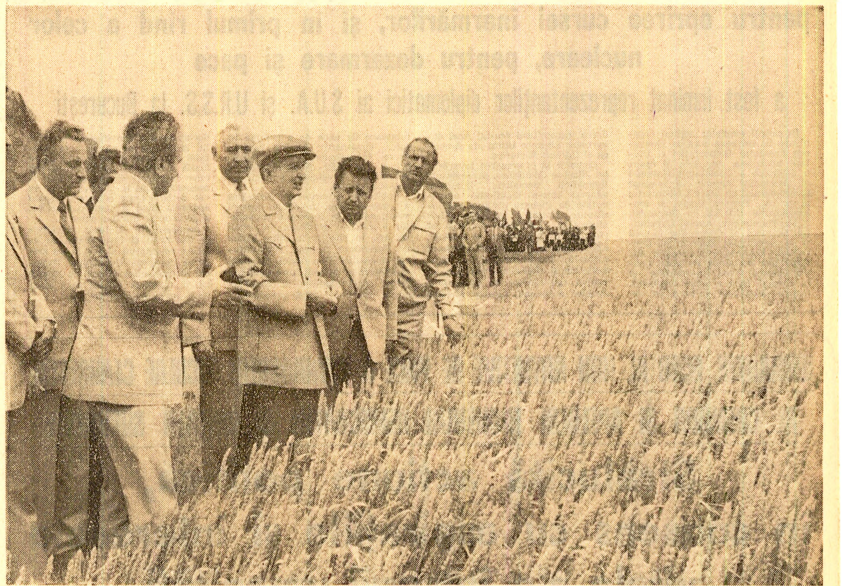
La Întreprinderea agricolă de stat „Drumul subtire”

Vizita tovarăşului Nicolae Ceauşescu în această unitate a avut drept scop analiza modului în care sînt transpuse în viaţă indicaţiile cu privire la realizarea culturilor intensive şi extinderea lor în vederea obţinerii de recolte tot mai bogate. Primarul comunei, Gheorghe Duca, şi preşedintele cooperativei, Constantin Ivan, informau pe secretarul general al partidului că unitatea lor a însemnat în acest an importante suprafeţe cu culturi intensive, care au fost întreţinute potrivit regulilor agrotehnice cerute de asemenea culturi. Este vorba de 100 ha de grâu, cu densităţi mari, pe care se va obţine o