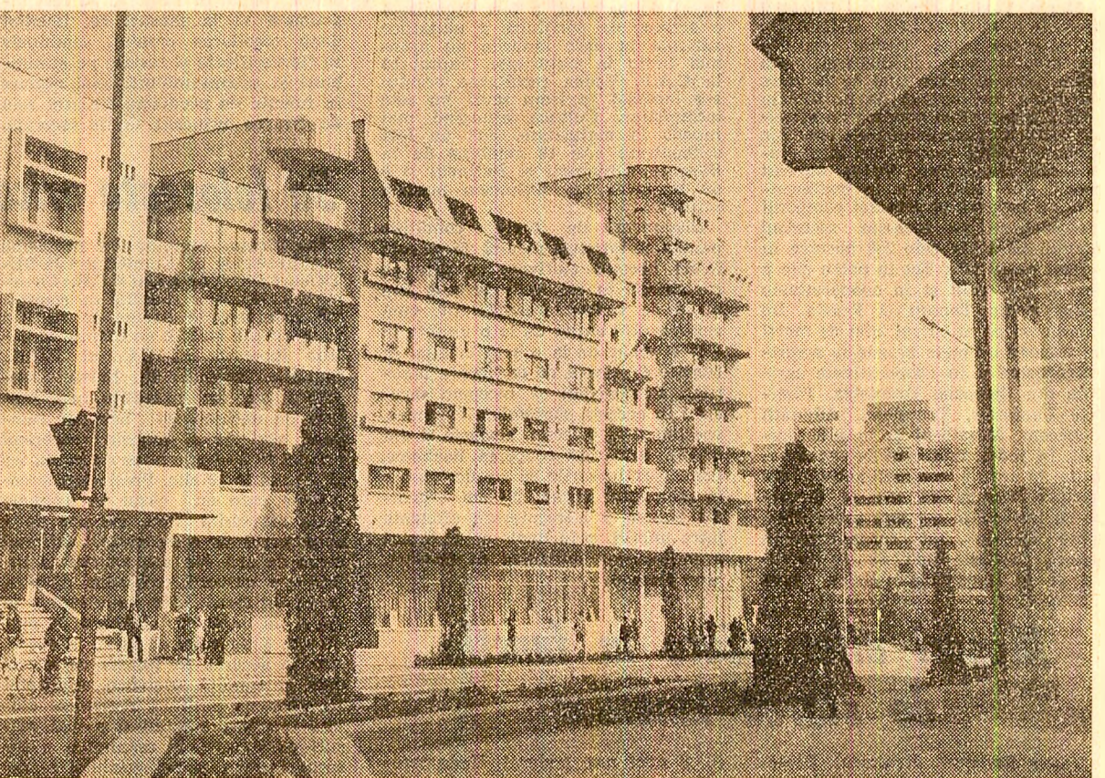
Din noua arhitectură a municipiului Rimnicu Vilcea