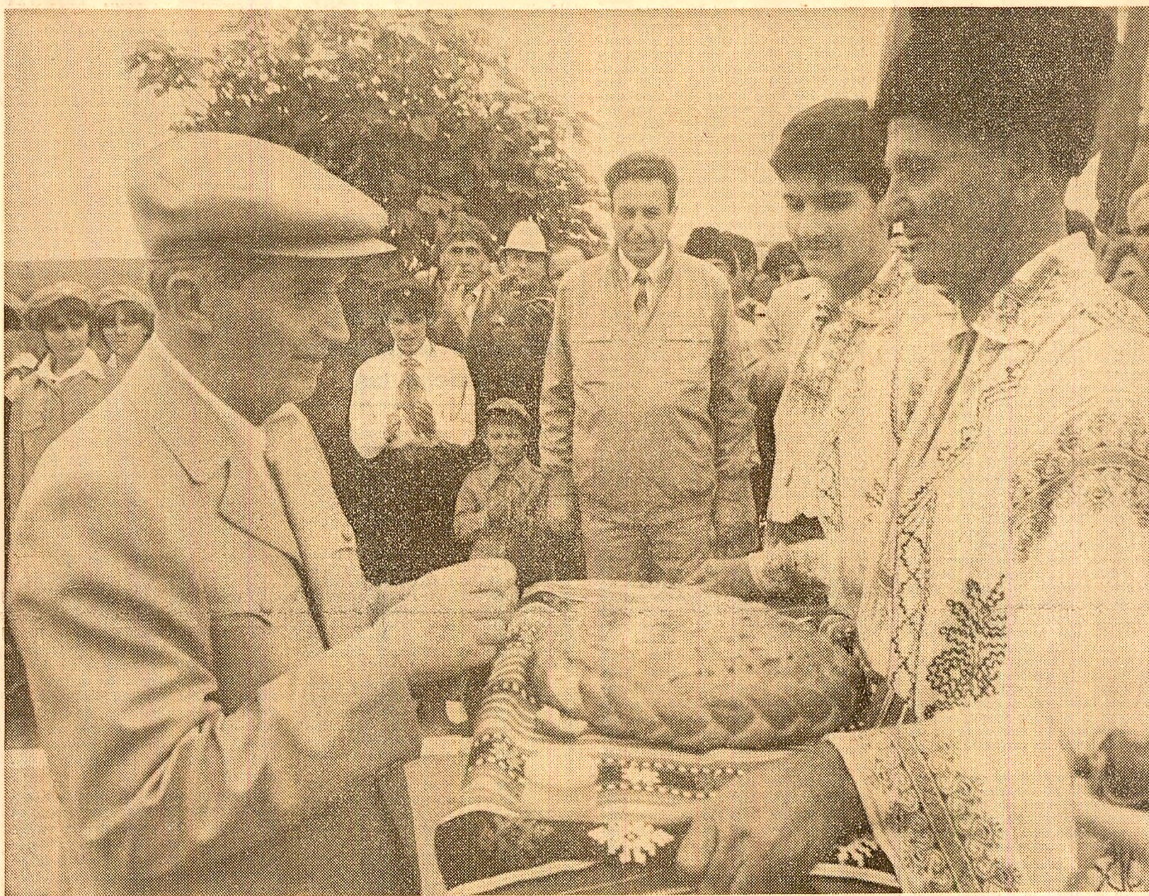
Tovarășul Nicolae Ceaușescu este întâmpinat cu deosebită stimă, cu sentimente de profundă dragoste și prețuire de locuitorii din Ștefan Vodă

Un nou și rodnic dialog cu specialiști și oameni ai muncii din agricultură în vederea dezvoltării intensive și accelerate a acestei ramuri de bază a economiei, pentru obținerea unor recolte superioare de cereale și plante tehnice