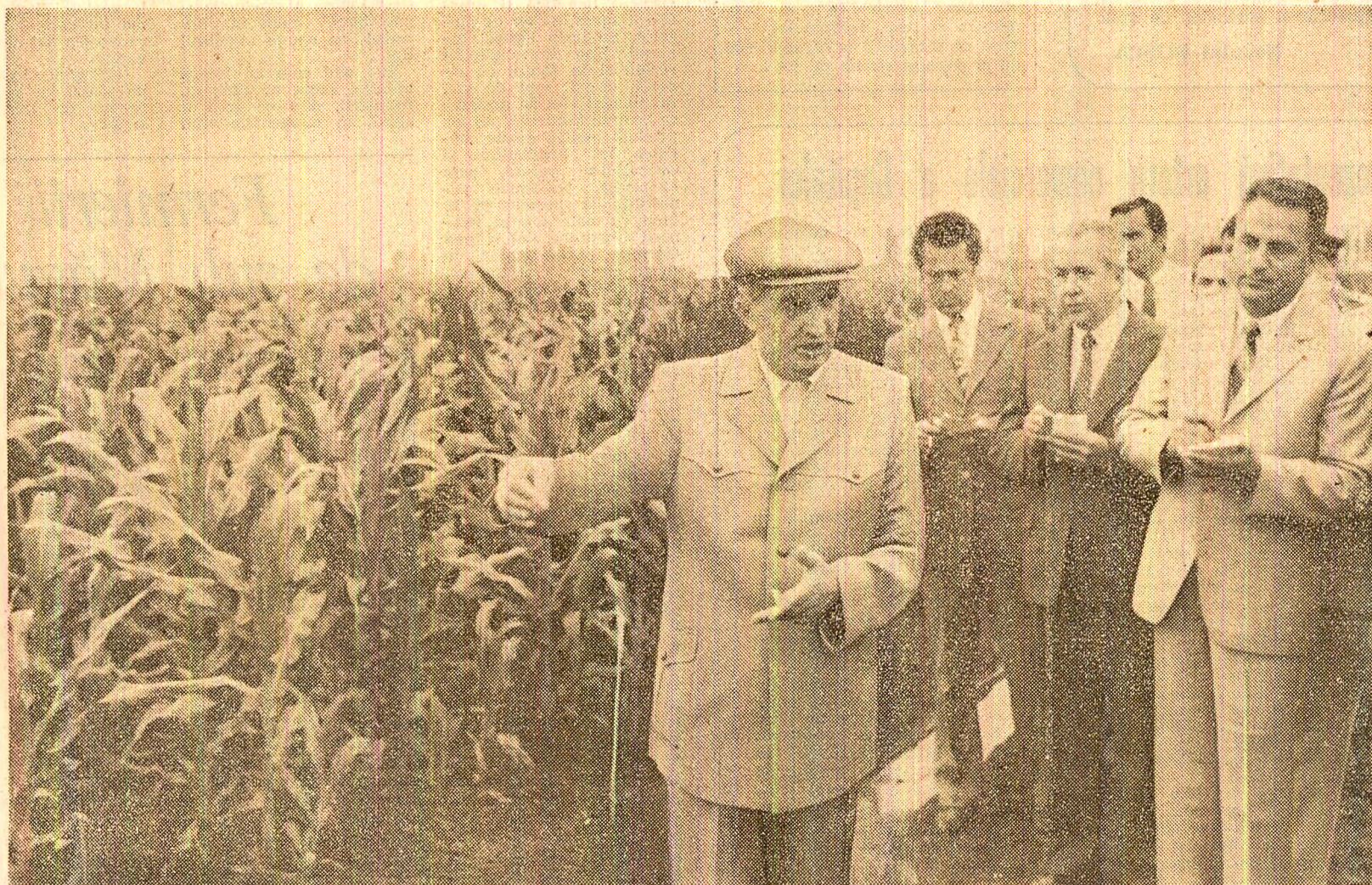
În timpul vizitei la Institutul de cercetări pentru cereale și plante tehnice de la Fundulea