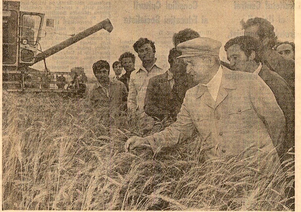
Una din imaginile-document care ilustrează dialogul neîntrerupt al secretarului general al partidului cu oamenii muncii de pe ogoare în problemele modernizării acestei ramuri de bază a economiei naționale, creșterii producției vegetale și animale, pentru progresul continuu al agriculturii noastre socialiste, pentru ridicarea bunăstării întregii populații

AGRICULTURII SOCIALISTE — O PUTERNICĂ BAZĂ TEHNICO-MATERIALĂ Investițiile sporite — la temelia creșterii forței productive