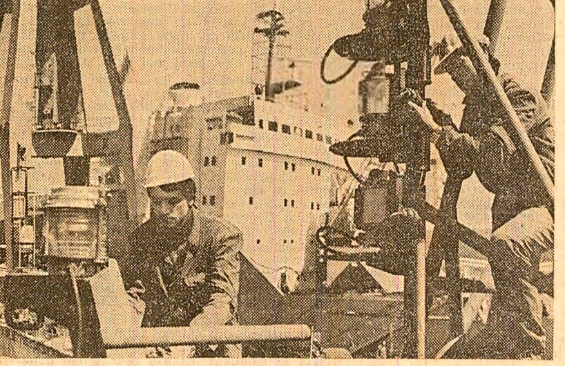
Santierul naval din Brăila. La cheiul de armare, montorii finalizează o nouă navă.

Întrecerea socialistă care se desfășoară în aceste zile pentru îndeplinirea și depășirea sarcinilor de plan în general și la producția fizică în special, trebuie să aibă, prin urmare, în vedere perfecționarea activității în ansamblul ei, atât din punct de vedere organizatoric, al metodelor și stilului de conducere, cât și al tehnologiilor aplicate. Îndeplinirea planului la producția fizică nu poate fi urmărită separat de problema care vizează nivelul consumurilor materiale, al energiei, al productivității muncii, al eficienței economice. (Ion Teodor).