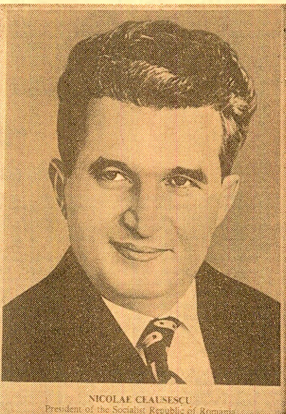
NICOLAE CEAUȘESCU Președintele Republicii Socialiste România