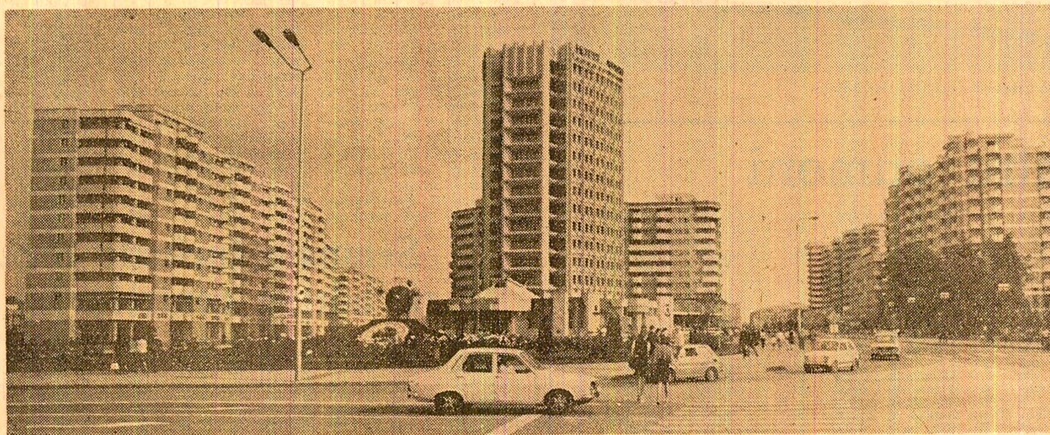
Așa arată astăzi străvechiul Bacău