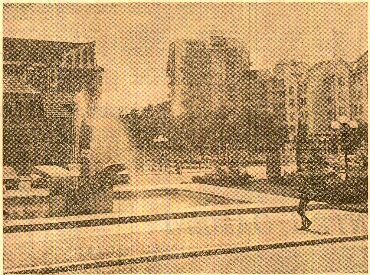
Din noua arhitectură a municipiului Bistrița

Gheorghe CRÎȘAN corespondentul „Scintei”