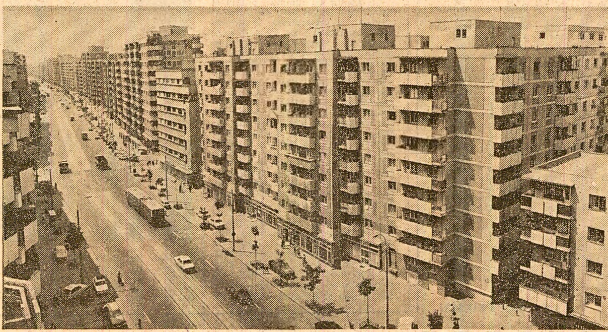
Construcții noi pe vechea arteră bucureșteană Călea Moșilor