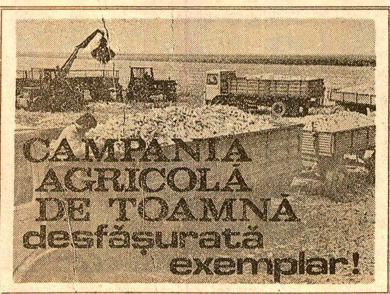
CAMPANIA AGRICOLA DE TOAMNA desfășurată exemplar!

Semănatul grâului a intrat în linie dreaptă. În șase zile, câte un mai timp până la 10 octombrie, sîntem mai trebuie pusă sub brazdă 1.300.000 hectare. Dacă în județul Covasna semănatul s-a încheiat, iar în celelalte intră în stadiu avansat, există și județe unde se constată serioase întâzieri față de perioada de timp în care ne aflăm. În legătură cu măsurile ce se întreprind pentru intensificarea la maximum a însămînțării grâului, am solicitat directorilor direcțiilor agricole din județele CLUJ și CARAȘ-SEVERIN să răspundă la întrebările: