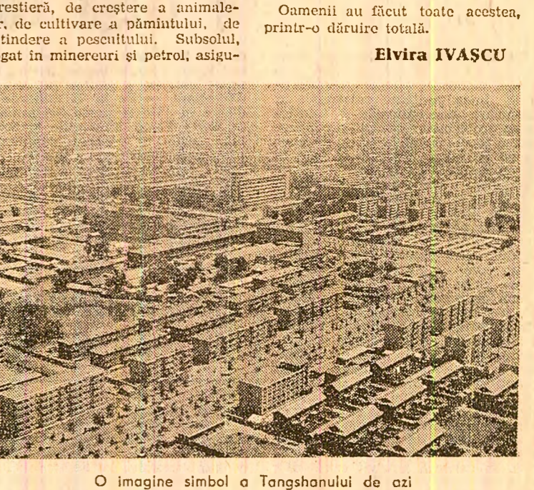
O imagine simbol a Tangshanului de azi