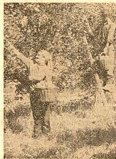
Importante forțe umane sînt mobilizate în aceste zile la recoltarea merelor în bazinul pomicol din Volea Dimboviței

Aurel PADADIUC Gheorghe MANEA correspondentul „Scintei”