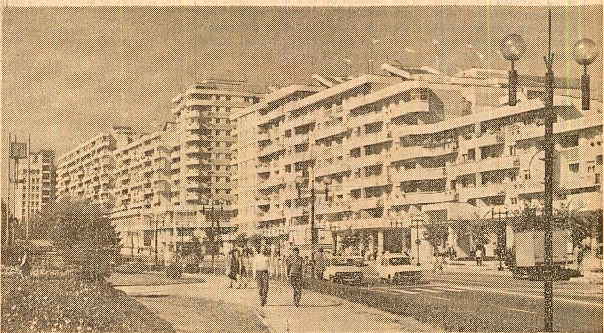
Municipiul Pitești se remarcă printr-o arhitectură modernă ce conferă frumuseții orașului o notă aparte

Telegrame adresate tovarășului Nicolae Ceaușescu PAGINA A III-A