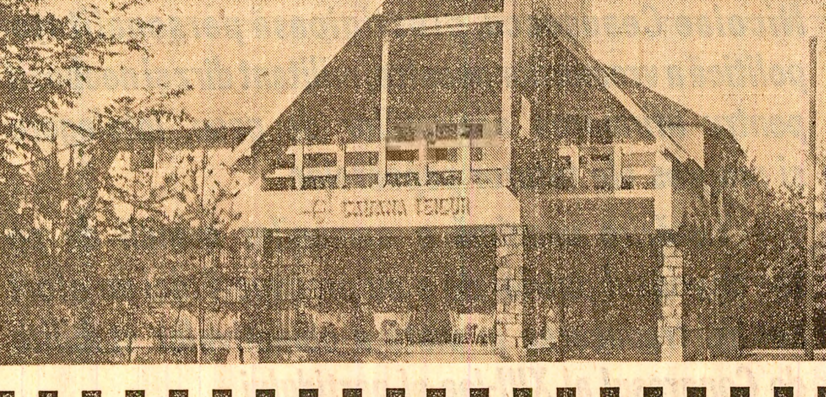
Noile edificii ale municipiului Bistrița: frumusețe și trainicie

Consiliul popular județean, cu sprijinul Ministerului Comerțului Interior, a elaborat un amplu stu-