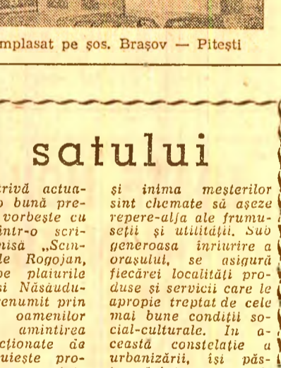
Hanul Bran, amplasat pe șos. Brașov — Pitesti

dar deopotrivă actuală — cu o bună pregătire, ne vorbește cu pasiune, într-o scrișoară trimisă „Scinteia”, Vasile Rogojan, cătrează într-o scrisoare prințesească de la Bistrița și Năsăudului, înținat renumit prin incusina oamenilor săi, unde amintirea morilor acționale de apă, prezintă o producție de astăzi... Se vorbește adesea de folosirea micilor ruiete de la sate și a forței vântului. Pentru aceasta, trebuie să ne întoarcem la vremurile noastre, să ne amintim de oamenii care să le pună în funcțiune și să le repare la nevoie. Or, în momentul de față mesterii specifici satului s-au restrîns. Unde e fierarul care să repare fierul de plute, sapa, coasa și alte unelte trebuincioase gospodăriei sătești? Dar nu numai de fier e nevoie la sate, ci și de țelmar, croitor, zidar, dulgher, pantofar, electrician, șofer, tîncișiu, vopsitor, cînd e nevoie de oi și se alegează adesea la oraș... Iar alții ne scriu despre necesitatea prezentelor unor mesteri precum în repararea televizoarelor, mașinilor de spălare și altor asemenea bunuri specifice satului românesc de azi. Între spațiul de întințire a muncii noastre, înțințirea pe care ni-l decidea antologia de arhitectură rurală din vecinătatea lacului Hîrăstrău, și amplul program de modernizare a satelor și sistematizarea satelor, se deschid oportunități în care mîna