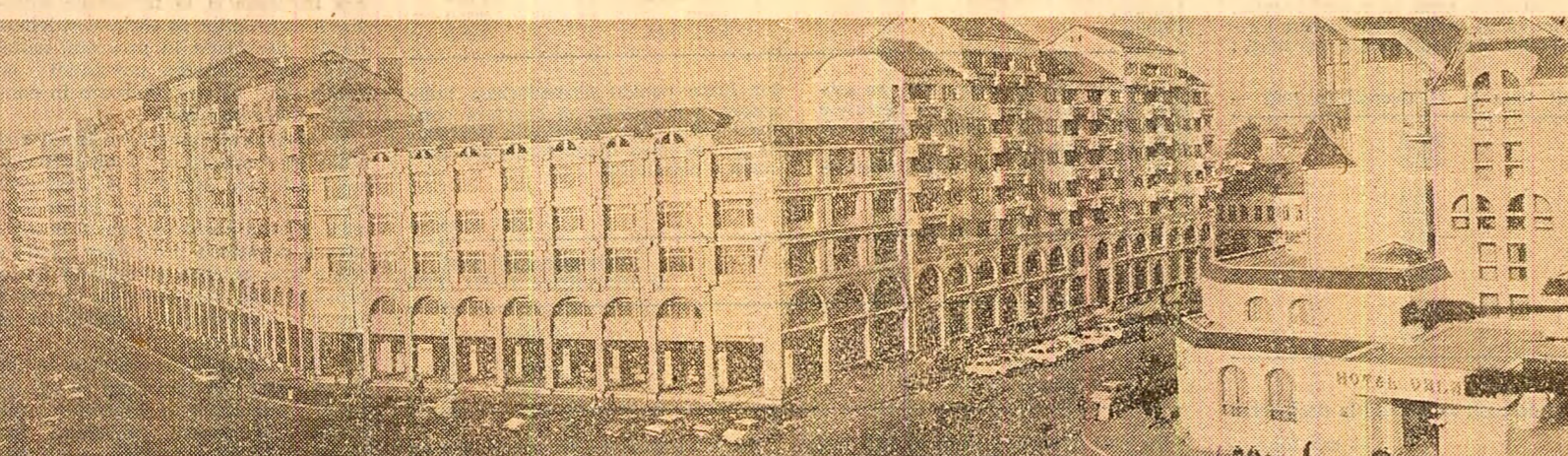
Imagine din centrul civic al municipiului Tîrgoviște, localitate angajată ferm, ca toate oazele patriei, pe drumul modernizării