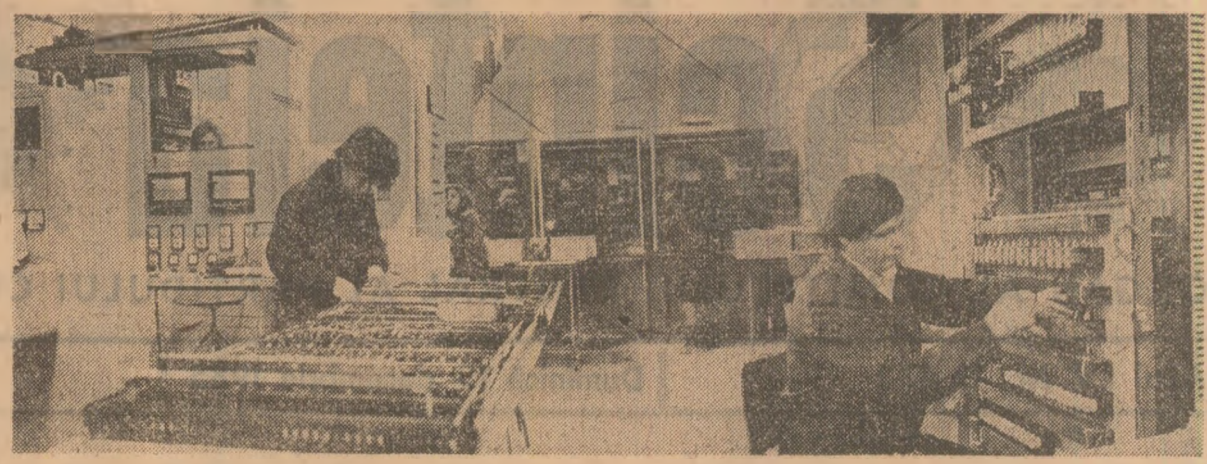
La întreprinderea de panouri electropneumatice din Bacău se finalizează un nou lot de produse care vor fi livrate în curând beneficiarilor

Anchetă realizată de Ion LAZAR, Tristan MIHUȚA