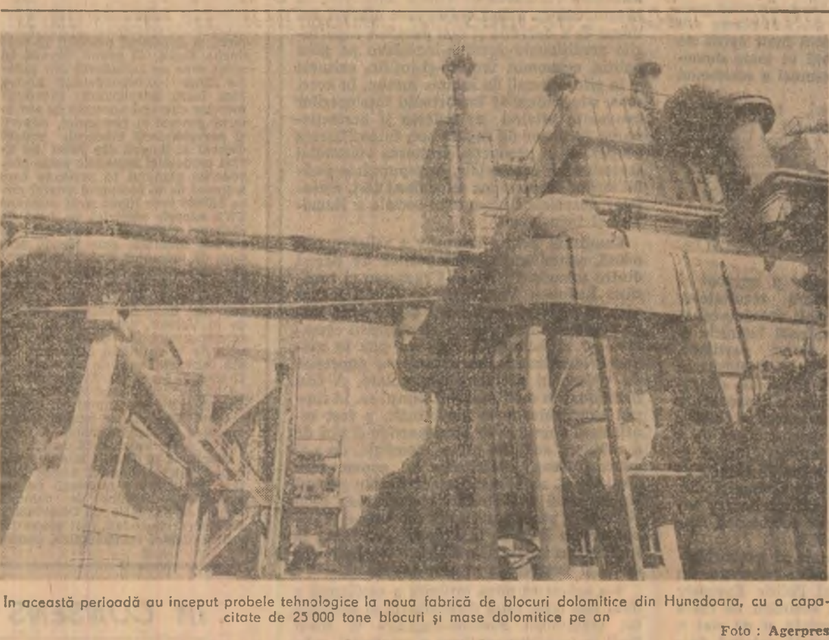
În această perioadă au început probele tehnologice la noua fabrică de blocuri dolomitice din Hunedoara, cu o capacitate de 25.000 tone blocuri și mase dolomitice pe an