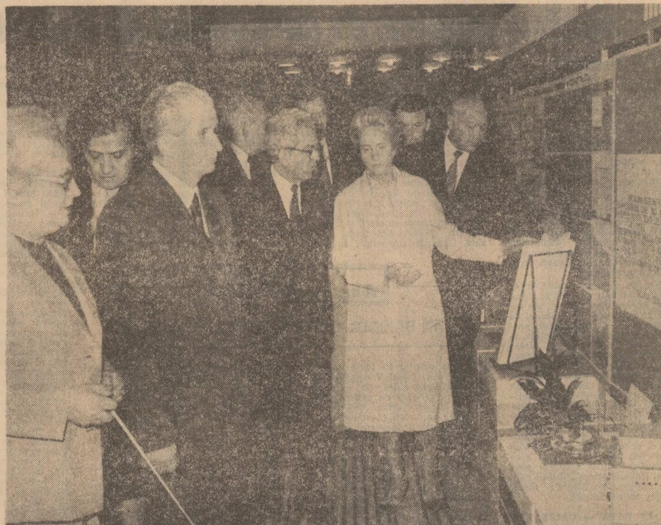
14 SEPTEMBRIE 1985. Tovarășul Nicolae Ceaușescu, împreună cu tovarășa Elena Ceaușescu vizitează expoziția „Epoca Ceaușescu — epoca de aur a învățămîntului românesc“, organizată la Iași cu prilejul deschiderii anului de învățămînt 1985-1986