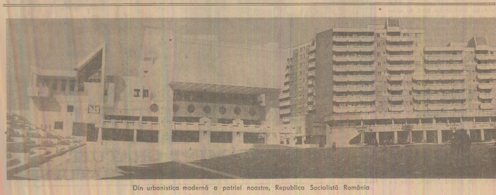
Din urbanistica modernă a patriei noastre, Republica Socialistă Română

De asemenea, au crescut de 5,9 ori (Continuare în pag. a II-a)