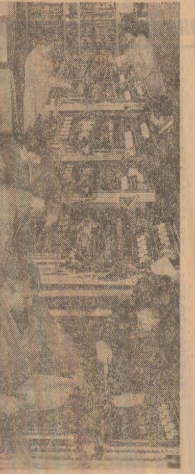
Aspect de muncă de la întreprinderea bucureșteană „Automatice”.