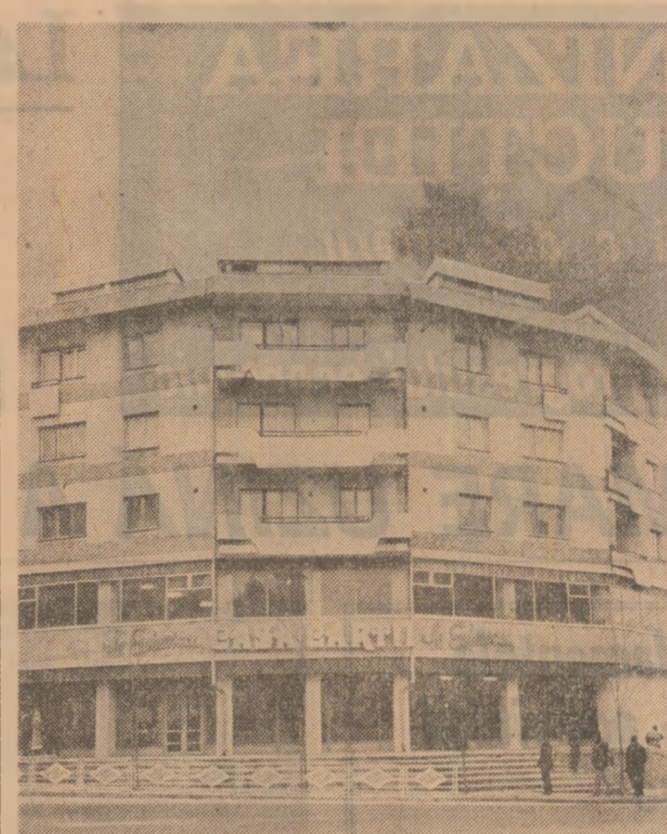
Noua Casă a cărții din Suceava.