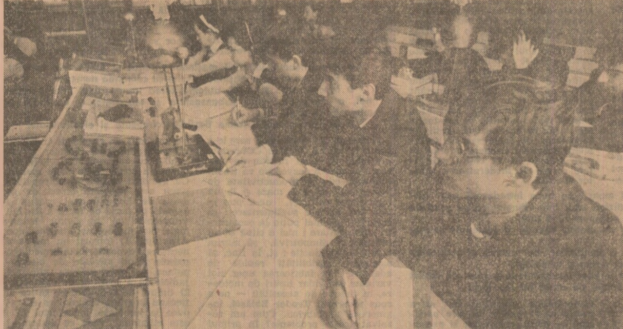
Liceul industrial nr. 10 din București: elevi la orele de practică în laboratoarele de specialitate.