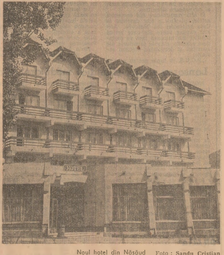
Noul hotel din Năsoed