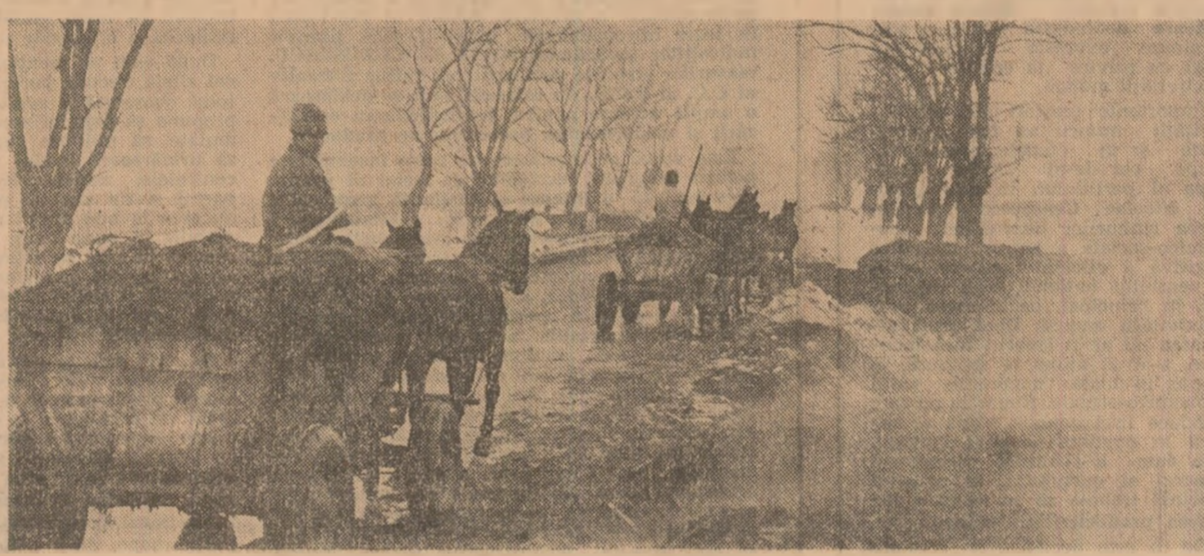
La C.A.P. Drăgănești Vlașca, județul Teleorman, se acționează intens la transportul îngrășămintelor naturale în cîmp.

Am redat aceste prevederi ale legii în primul rînd pentru acele faturi care au intrizat, neutilizînd, trimitea către redacție a răspunsurilor la unele scrisori. Este vorba de Consiliul popular al județului Dolj (scrisorile nr. 86 684 din 8 noiembrie și nr. 86 491 din 20 octombrie 1985); Comitetul județean Mureș al P.C.R. (scrisorile nr. 79 222 din 2 martie 1985); Comitetul județean Botoșani al P.C.R. (scrisorile nr. 42 497 din 15 august 1985); Consiliul popular al județului Constanța (scrisorile nr. 42 529 din 10 august și 42 827 din 5 noiembrie 1985); Uniunea județeană a cooperativei de producție, achiziții și distribuție a metalelor Argeș (scrisorile nr. 85 432 din 24 iunie 1985); Uniunea județeană a cooperativei agricole de producție Vileca (scrisorile nr. 85 831 din 12 august, 86 754 și 86 927, ambele din luna noiembrie anul trecut).