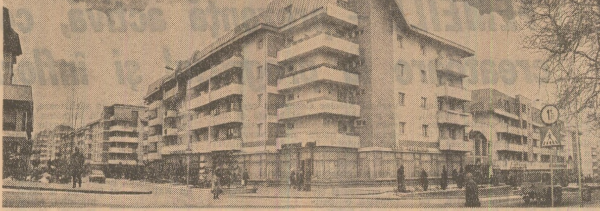
Construcții moderne la Suceava.