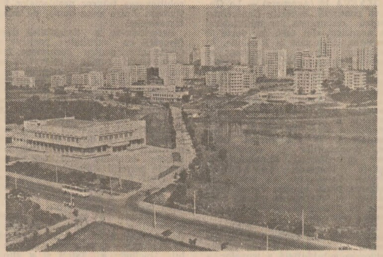
În programul de amenajare a litoralului de vest al R.P.D. Coreene...