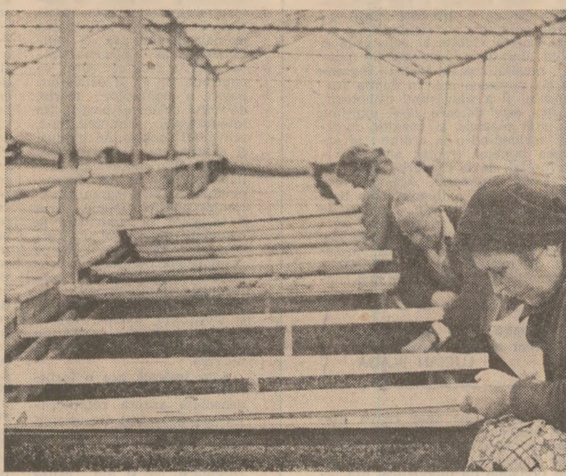
Lucrări de întreținere a răsădușilor de tomate la C.A.P. Drăgănești-Vlăsca, județul Teleorman.

pentru culturile de volum — porumb, floarea-soarelui, soia și fasole — se face cu mijloace de transport special pregătite, care sînt etanșizate, îmbrăcate în folie de polietilenă și acoperite cu prelate. Fiecare sac poartă eticheta privind rezultatele analizelor de laborator. Pe baza măsurilor luate de comandamentul județean pentru agricultură, aproape toate cantitățile de sămînțe necesare campaniei de primăvară se află în unitățile producătoare.