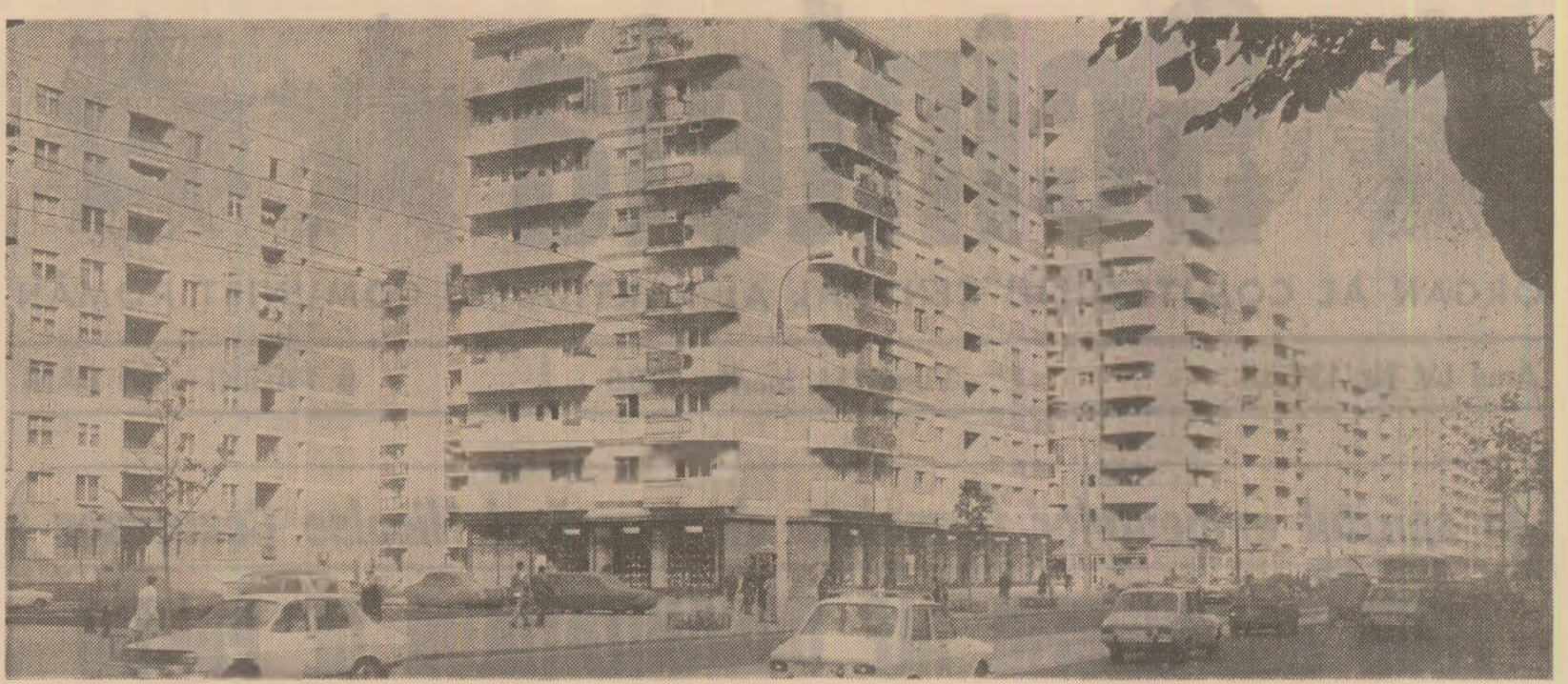
Noi construcții de locuințe pe calea Moșilor din Capitală

— Pe urmele unor scrisori, la adrese noi