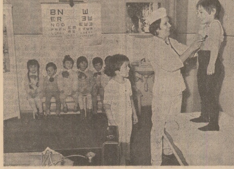
Grijă deosebită pentru sănătatea celor mai mici „pacienți” de la grădinița de copii a întreprinderii „Tractorul” din Brașov

Orientîndu-se cu procedere activitate asupra desfășurării în ritm susținut a lucrărilor din campania agricolă de primăvară, organele unităților de partid, birourile de coordonare a activității politico-organizatorice de partid și comitetul de partid au îndatorirea de a acționa cu perseverență pentru unirea eforturilor și energilor creatoare ale comunistilor, ale tuturor oamenilor muncii de la sate în desfășurarea în cit mai bune condiții a campaniei agricole de primăvară, pentru instaurarea unui spirit de înaltă răspundere și disciplină în realizarea tuturor lucrărilor în perioade optime de timp stabilite și la un nivel agrotehnic superior, spre a se pune un fundament tracic recoltelor superioare prevăzute în planul pe acest prim an al nouîncincinal.