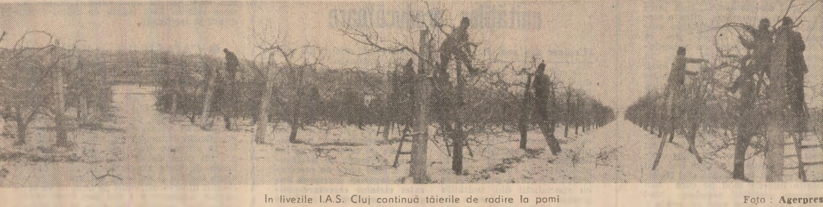
În livezile I.A.S. Cluj continuă tăierile de rodire la pomi.

Gheorghe BALTA correspondentul „Sciuteii”