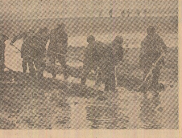
La C.A.P. Malu și Bolintin-Vale (județul Giurgiu), prin rigoale și șanțuri, echipe de cooperatori deschid drum apei spre canalele de desecare.

Dați în nordul și în centrul județului se lucrează cu sape, cazmale și lopeti, în zona de sud, în sistemele de irigații Zimnicea, Turnu Măgurele. Piața au fost puse în funcțiune toate stațiile de desecare. În raze de activitate a sistemului de hidromeliorații Turnu Măgurele, cele patru stații de desecare funcționează la întreaga capacitate ziua și noaptea. În stația „Săraru”, unde excesul de apă este mai mare, s-au montat suplimentar încă două agregate de pompare, mărindu-se astfel debitul stației cu 2.500 metri cubi pe oră.