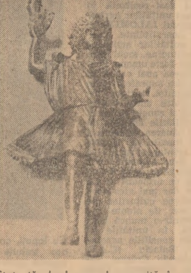
Vas-binoclu descoperit în stațiunea neolitică de la Poduri - Bacău