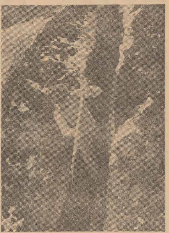
Cu lopeti, cu motopompe, cu toate mijloacele posibile - așa trebuie acționat pretendenții unde apa bălățește pe ogoare pentru a asigura dezvoltarea normală a semănăturilor de toamnă și începerea neîntârziată a însămânțărilor.

Prundu, în patru zile, a fost eliminată apa de pe aproape 700 de hectare. Acesta citeva măsuri puse în evidență hotărârea oamenilor muncii de pe ogoarele judetului Giurgiu de a realiza în bune condiții toate lucrările din actuala campanie agricolă. (Ion Manea, corespondentul „Scintei”).