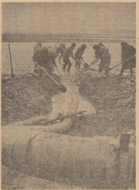
La C.A.P. Malu și Bolintin-Vale (județul Giurgiu), prin rigoale și șanțuri, echipe de cooperatori deschid drum apei spre canalele de desecare.

Dați în nordul și în centrul județului se lucrează cu sape, cazmale și lopeti, în zona de sud, în sistemele de irigații Zimnicea, Turnu Măgurele. Piața au fost puse în funcțiune toate stațiile de desecare. În raze de activitate a sistemului de hidromeliorații Turnu Măgurele, cele patru stații de desecare funcționează la întreaga capacitate ziua și noaptea. În stația „Săraru”, unde excesul de apă este mai mare, s-au montat suplimentar încă două agregate de pompare, mărindu-se astfel debitul stației cu 2.500 metri cubi pe oră.