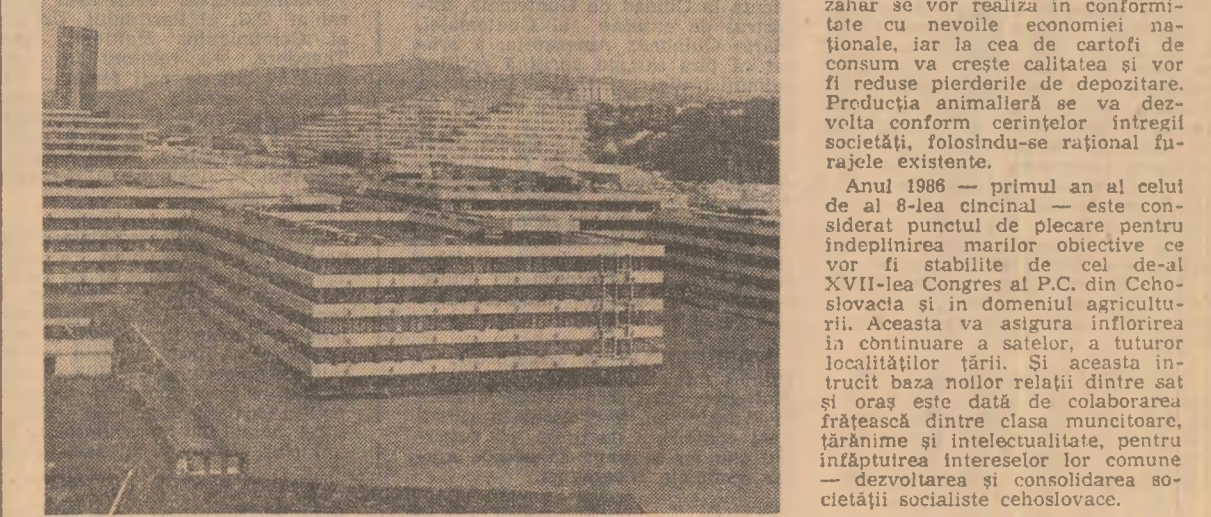
Oraselul studenților din cartierul Mlynska Dolina, din Bratislava