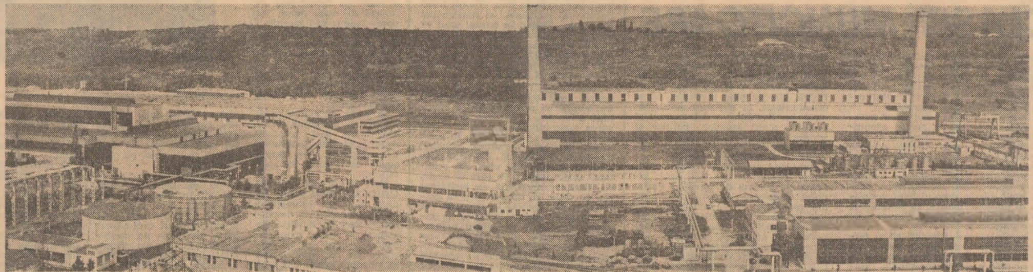
Combinatul de utilaj greu din Iași — unul din marile obiective industriale create sub simbolul gândirii inovatoare a secretarului general al partidului, tovarășul Nicolae Ceaușescu, în cele peste două decenii care au trecut de la Congresul al IX-lea al partidului

tate din documentele de partid, că se cere conducătorului locului de muncă să se manifeste ca om politic, sau că elaborarea deciziilor și hotărâ-