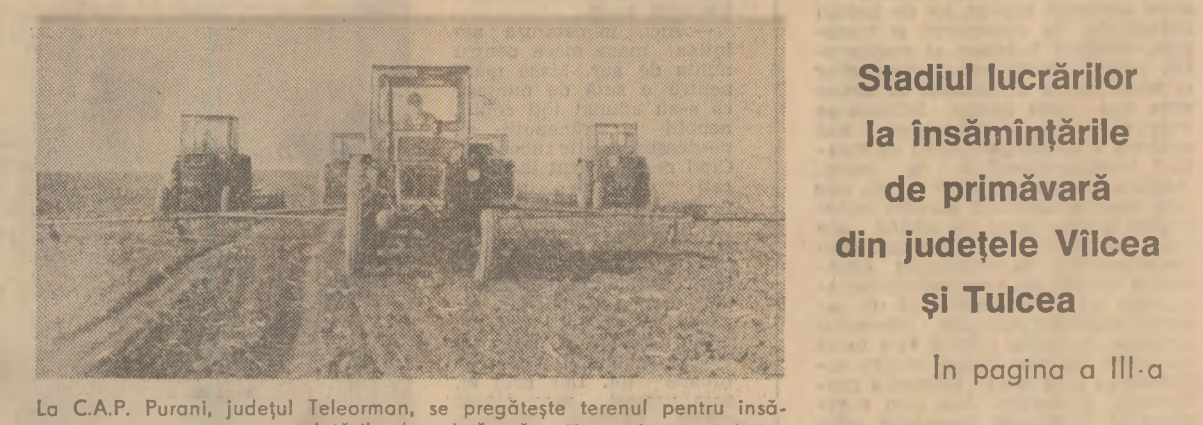
Lo C.A.P. Purani, județul Teleorman, se pregătește terenul pentru însămînțările de primăvară.