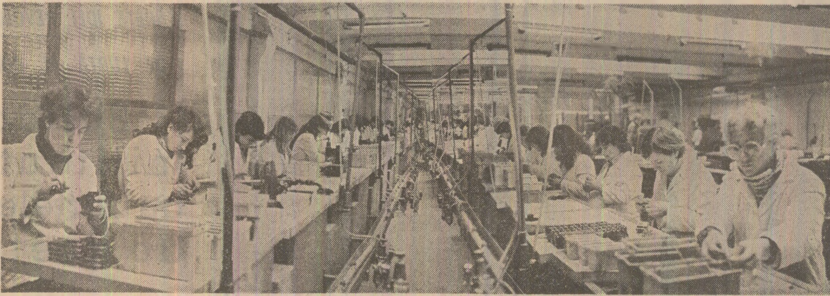
Fotografia de față reprezintă o imagine-simbol pentru nivelul de dezvoltare și modernizare la care s-a ridicat, azi, industria românească, pentru prezența tineretului în primele rînduri ale bătăliei pentru o nouă calitate a muncii. O elevată mîndritură a participării responsabile a tineretului la asigurarea progresului patriei. Asemenea tinerilor de la Intreprinderea de aparat electric pentru instalații din Focșani, surprinși într-un moment al procesului de producție, ale milioane și milioane de tineri multiplică această imagine ce echivalează cu o semnătură de prestigiu: munca pentru țară.

Anchetă realizată de AI. PINTEA , cu sprijinul corpondenților „Scînteii”