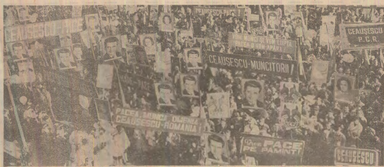
Glasul de pace al poporului român

În spiritul unei înalte răspunderi față de interesele vitale ale întregii omeniri, Partidul Comunist Român militează cu hotărîre pentru întărirea unității de acțiune a tuturor forțelor progresiste ale umanității pentru înfăptuirea dezarmării, pentru apărarea dreptului suprem al popoarelor — dreptul la pace, la viață, la o dezvoltare liberă și demnă.