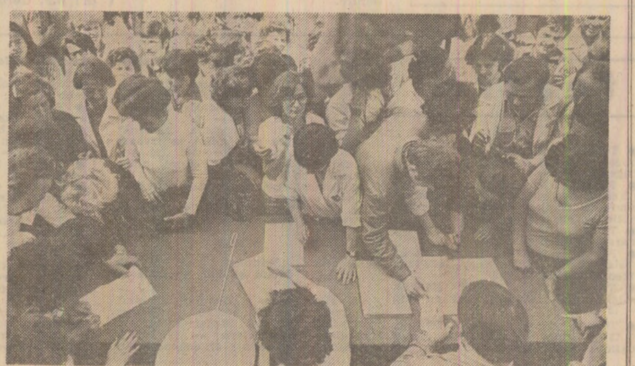
Semnături pe Apelul pentru dezarmare și pace

Sub semnul generoaselor ideal înscris pe frontispiciul ANULUI INTERNAȚIONAL AL PĂCII, partidul nostru cheamă la intensificarea luptei unite a forțelor înaintate de pretutindeni, cu convingerea că stă în puterea popoarelor să pună stavilă curselor înarmărilor pe Pămînt ca și în Cosmos, să determine înlăturarea primejdiilor nucleare, să asigure triumful păcii.