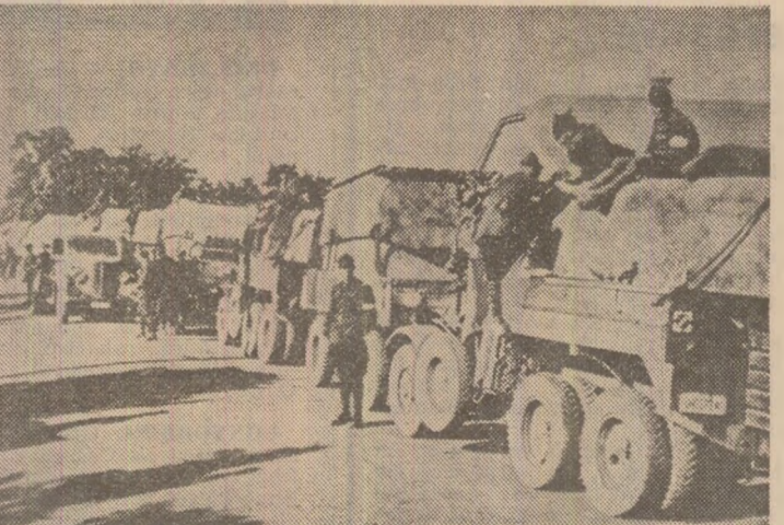
Coloană a armatei române, pe frontul antihitlerist