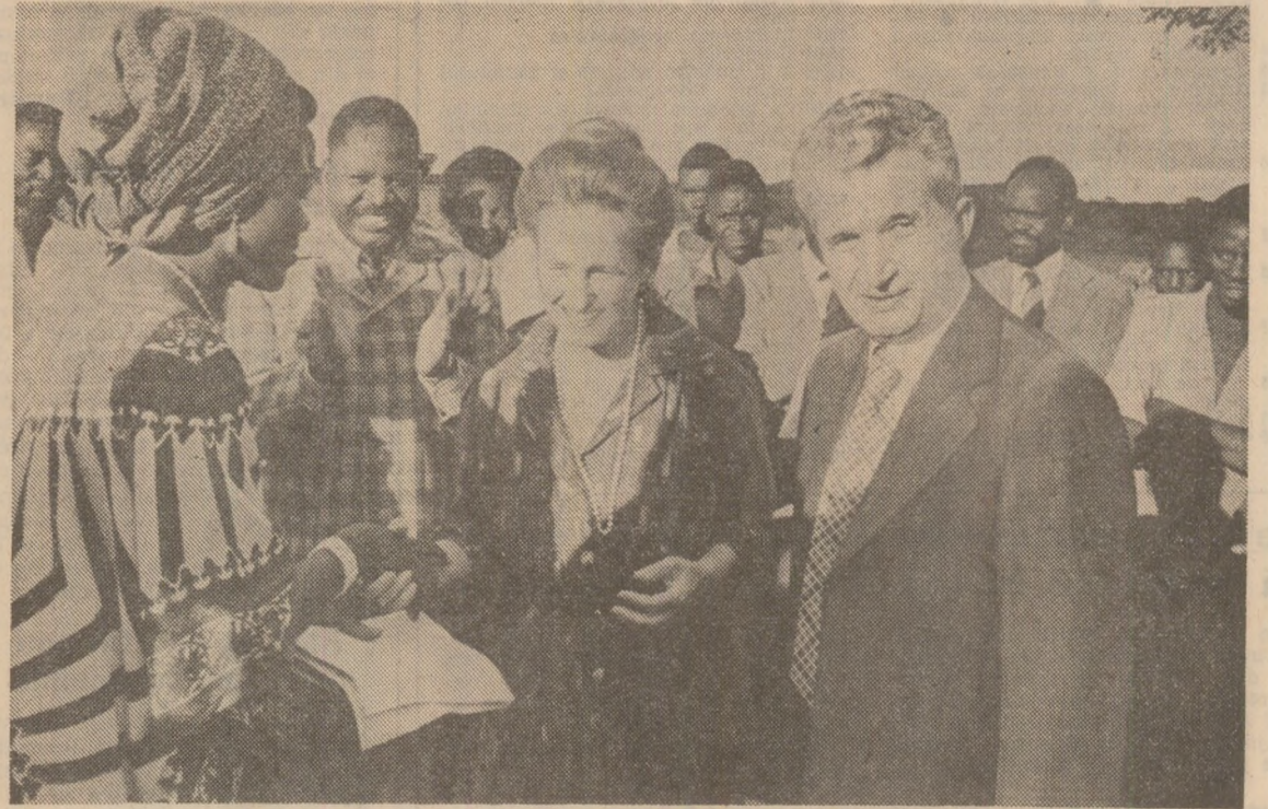
Salie de pace și prietenie, salie de solidaritate pentru cauza libertății și independenței

unitatea este izvorul forței și chează succesul în lupta pentru transformarea înnoitoare a societății, pentru asigurarea păcii în lume. În acest spirit, partidul nostru dezvoltă strînse relații de colaborare și solidaritate cu partidele comuniste și muncitorești, socialiste și social-democrate, cu mișcările de eliberare națională, cu partidele democratice din țările în curs de dezvoltare. Multitudinea și diversitatea acestor relații sînt indisolubil legate de activitatea neobosită a tovarășului Nicolae Ceaușescu, de nenumăratele sale contacte, întâlniri și convorbiri cu conducătorii și membrii mișcărilor progresiste din întreaga lume. Această vastă activitate în slujba cauzei solidarității a asigurat partidului nostru un loc marcant în mișcarea revoluționară mondială, făcînd ca Partidul Comunist Român, secretarul general al partidului să se bucure de profundă stimă și înalt prestigiu pe toate meridianele.